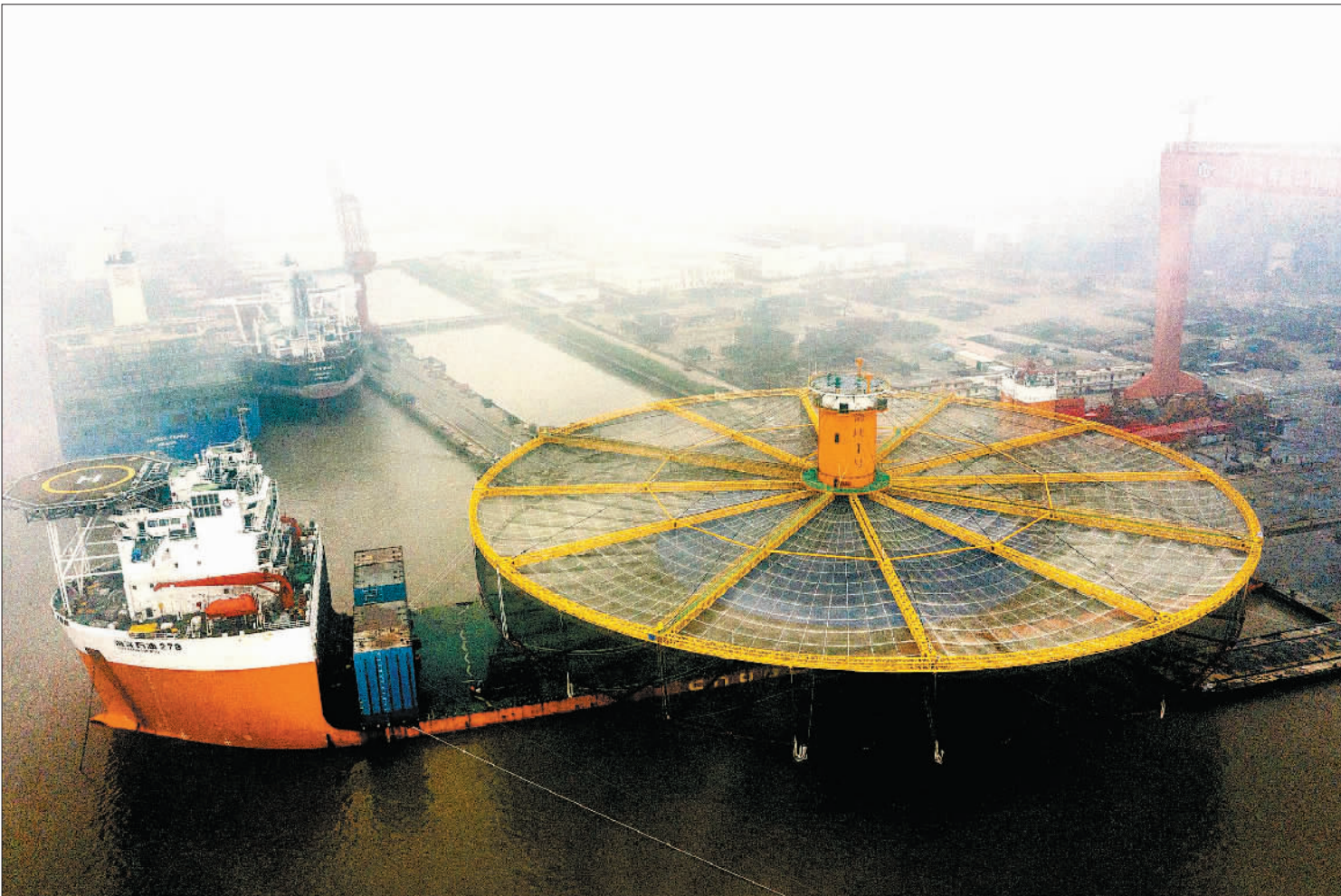
图:吉林化建高速公路隧道项目组织包机返岗

为保障员工健康安全,吉林化建通过施行返岗人员实名制登记、人员流动轨迹筛查、健康监测等,严格落实复工人员健康管理。“返岗直通车”内外进行多次消毒,严格