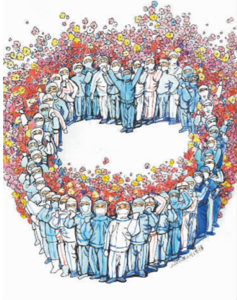
生命之花绚丽绽放