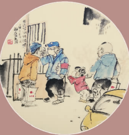
我还没测量体温呢！