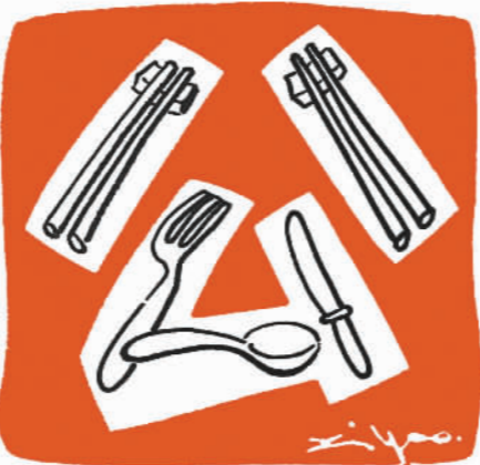
倡导公筷公勺，利己又利他。