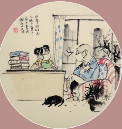
爸爸，你们怎么还不复工！