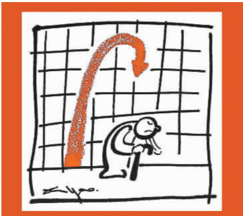
疫情的拐点快点来，人生的拐杖慢点来。