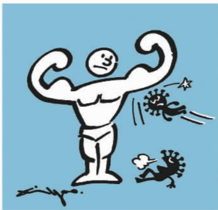
智力、财力、权利、最终是拼免疫力！