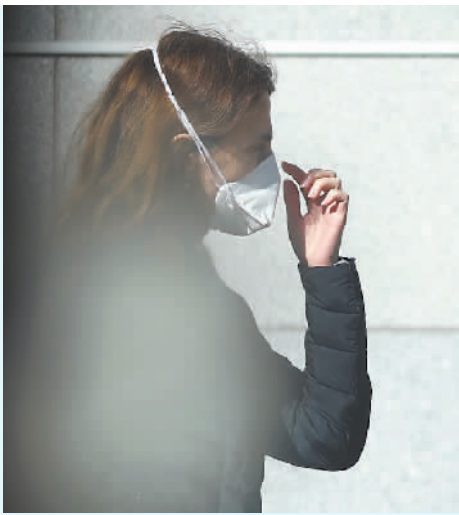
3月18日,在比利时布鲁塞尔,一名女子在街道上行走。