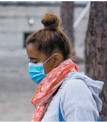
3月18日,在巴塞罗那,一名佩戴口罩的女子走在街上。