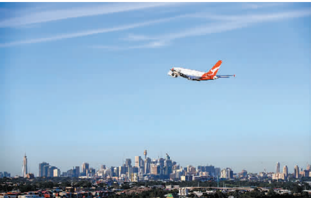
3月18日,一架澳航客机飞越澳大利亚悉尼上空。澳大利亚澳洲航空集团17日宣布,将削减九成的国际航班运力和六成的国内航班运力。

国际航空运输协会总经济师布赖恩·皮尔斯3月17日说,全球75%的航空企业手头现金不足以负担今后3个月不可避免的固定成本开支。该协会呼吁各国政府向航企“输血”。据报道,受新冠肺炎影响,全球多家航空运营商已经宣布削减航班及裁员决定,呼吁政府施以紧急援助。其中,美国三大航空运营商之一的联合航空公司4月和5月将削减50%航班;新西兰航空公司16日宣布削减85%远程航线并大幅裁员;法航—荷航集团16日说,今后几周将削减大约90%航班…… (郭济 辑)