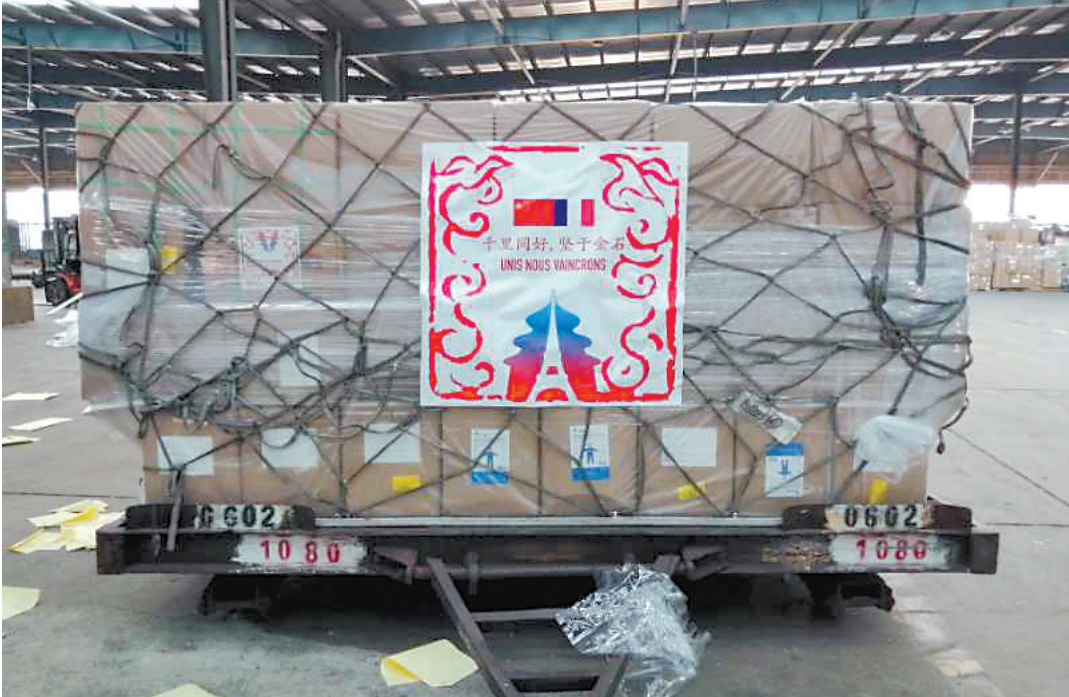
►3月18日,在津巴布韦首都哈拉雷,津卫生部和哈拉雷市的医卫官员在中国驻津巴布韦大使馆参加视频会议。中国外交部与国家卫生健康委员会18日共同举办中非新冠肺炎疫情卫生专家视频会议,来自中国、非洲疾控中心及24个非洲国家政府官员和卫生专家分享信息,交流经验。

然而,在疫情的冲击下,如何实现团结仍是欧盟和欧洲多国面临的难题。德国柏林夏里特医学院传染病研究学者瓦尔明德此前在接受《生命时报》记者采访时表示,“由于防疫是各成员国的内政,欧洲并