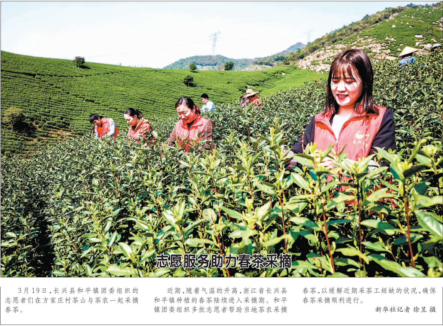
志愿服务助力春茶采摘

各地公布的一系列重磅投资计划,提振了市场信心,但同时也引发了一些担忧:“新基建”会不会走上“投资刺激”的老路,带来新的产能过剩?