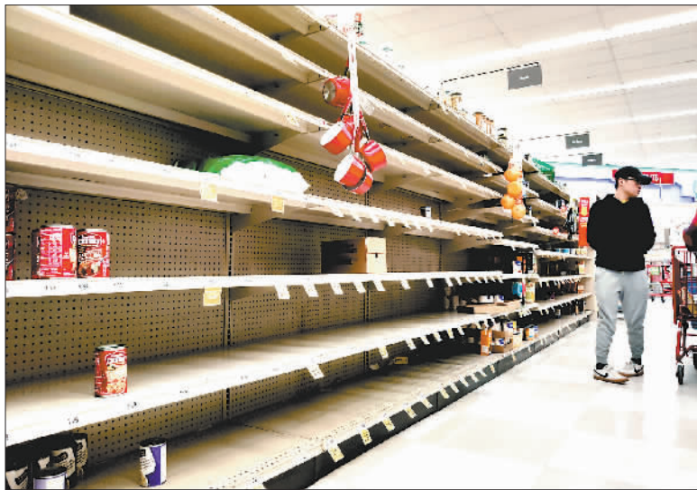
3月17日,在美国旧金山湾区米尔布雷市的一家超市,货架上的货物所剩无几。

民众为什么要抢卫生纸呢?这是一个制造商都无法回答的问题。 美国有线电视新闻网(CNN)采访美国多家大型卫生纸制造企业后发现,这些企业的订单急剧增长,虽然他们尽最大努力提高产量,却根本无法满足飞速增长的需求。 一家公司的CEO坦言,完全无法理解人们为什么要囤卫生纸。“我真的无法解释,这不像是我们突然间要使用更多……” 有分析认为,卫生纸价格相对低廉、保质期长,多囤一些也不会浪费。况且作为生活必需品,人们确实离不开它。