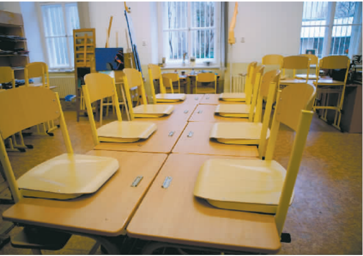
当地时间3月11日起,捷克全国学校和教育机构停课,这是11日在捷克布拉格一间小学拍摄的空无一人的教室。