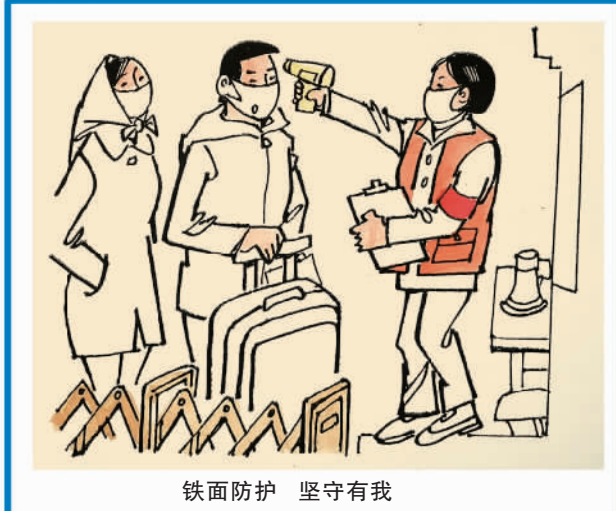
铁面防护 坚守有我