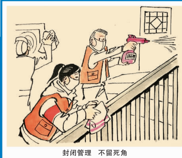
封闭管理 不留死角