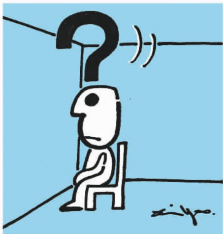
居家隔离,面壁思过好时机 郑辛遥

如果您认同我的看法,再看一眼辛遥先生的作品吧。从作品中人物的眼睛开始看,这一“点”,支撑了一个硕大的问号。倘若我们真正想通了,想透彻了,我想,这个问号会变成惊叹号,因为漫画是智慧的艺术,智慧就是力量