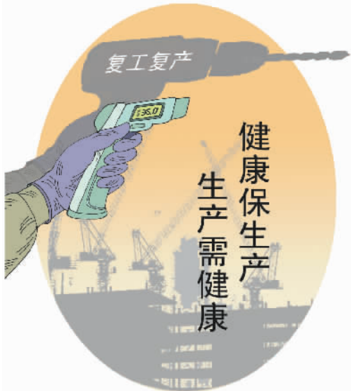
健康保生产 生产需健康