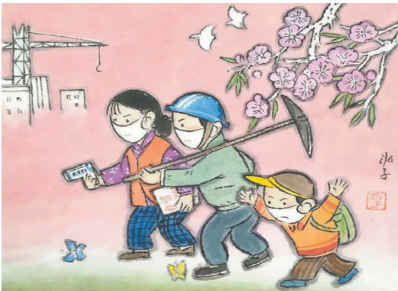
春暖花开复工日 你争我赶贡献时