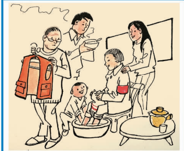
带病抗疾 人人敬佩