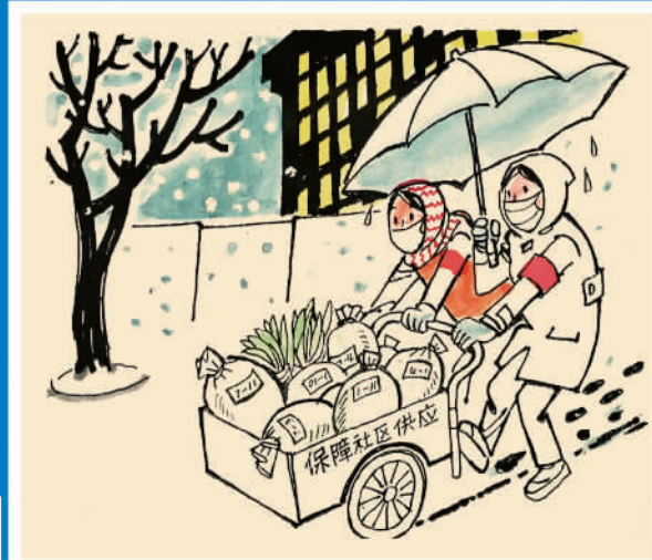
风中雪里 手托百家