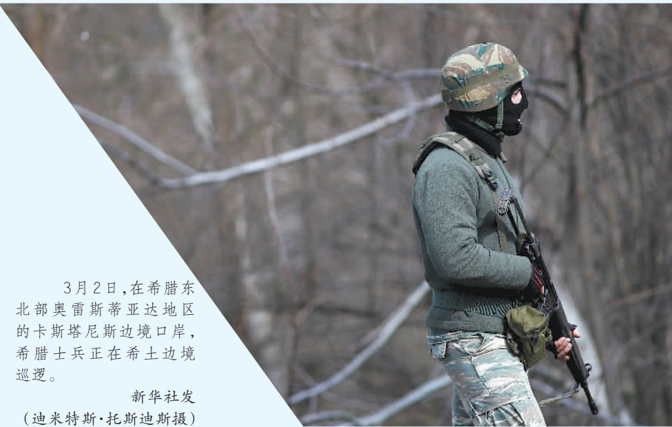
3月2日，在希腊东北部奥雷斯蒂亚地区的卡斯塔尼斯边境口岸，希腊士兵正在希土边境巡逻。