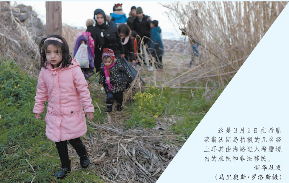
这是3月2日在希腊莱斯沃斯岛拍摄的几名经土耳其由海路进入希腊境内的难民和非法移民。