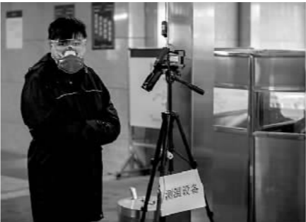
北京地铁2号线的一名保安正在进站口观察进站的乘客。