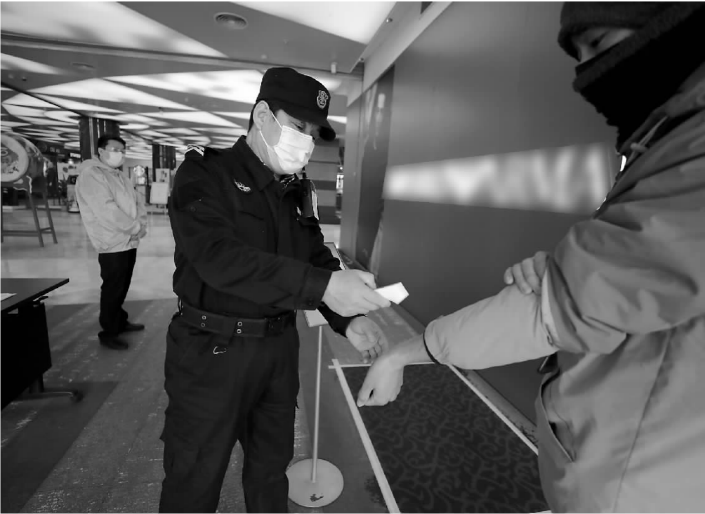
3月1日,北京一百货商场的保安正在给顾客测体温。

截至目前,新化实现县内返岗24957人,到岗率达86.4%;集中输送5400余名贫困劳动力到达广州、义乌、贵州等地返岗就业。