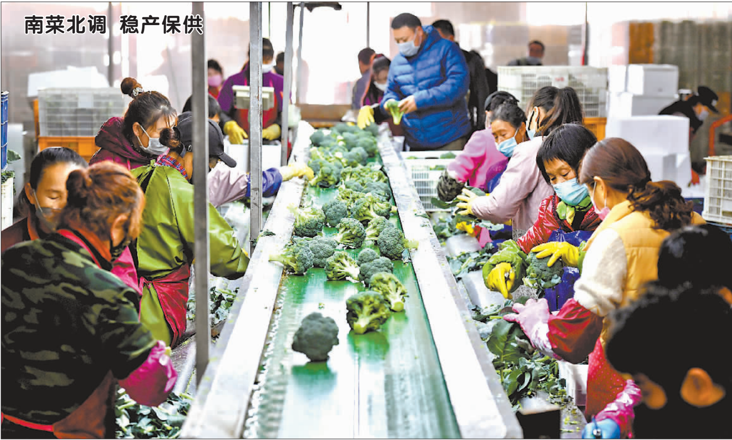
南菜北调 稳产保供