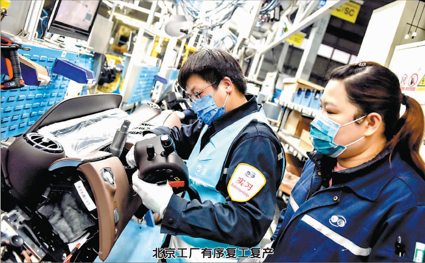
北京工厂有序复工复产

线下娱乐大幅减少,不少人转移至网络游戏、在线视频等线上娱乐形式。今年大年三十当天,《王者荣耀》流水为20亿元左右,去年同期则为13亿元。相关游戏上市公司的产品同样表现优异。春节期间,《少年三国志2》上线近2个月表现依然稳定;《一刀传世》榜单排名上升9位至第55位。