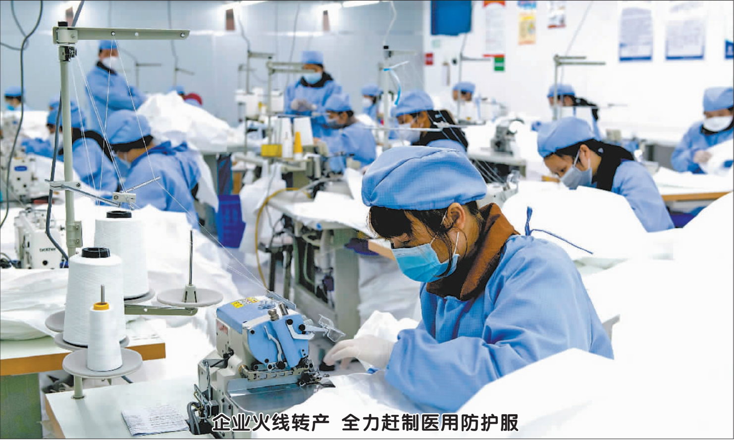
企业火线转产 全力赶制医用防护服

国家市场监督管理总局局长肖亚庆表示，当前人民群众对防疫用品、食品药品等重要民生商品的需求激增，市场监管部门搭建起民生期望与企业责任沟通互信的平台，推动企业庄严公开承诺保价格、保质量、保供应，有利于疫情防控期间全社会稳定预期、增强信心、同舟共济、凝聚形成疫情防控全社会合力。