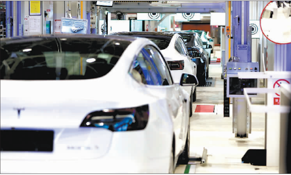
1月7日拍摄的特斯拉上海超级工厂内部。当日,特斯拉宣布启动在上海超级工厂制造Model Y汽车项目。同时,首批Model 3汽车在上海向公众进行交付。