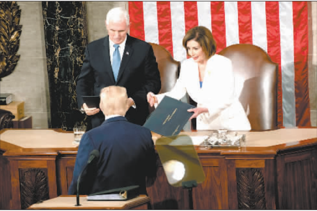
2月4日,在美国首都华盛顿,美国总统特朗普(前)在国会发表国情咨文演讲前拒绝众议院议长、民主党人佩洛西(后右)握手。