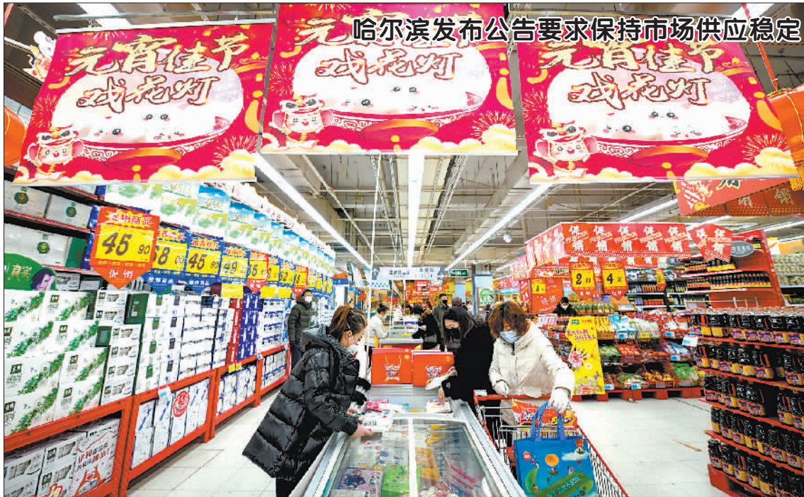
哈尔滨发布公告要求保持市场供应稳定

本报北京2月4日电 (记者刘静)记者从中国国家铁路集团有限公司获悉,2月4日,全国铁路预计发送旅客130万人次,同比下降88.5%。截至2月3日18时,全国铁路共有104个车站关闭离开当地通道,全国所有办理客运业务的车站都开展进站或出站旅客测温,共有384趟旅客列车下交发热旅客470人。