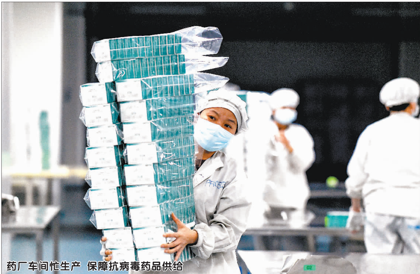
药厂车间忙生产 保障抗病毒药品供给

深圳则通过加快推进“出口转内销”的方式加大口罩供应。原用于出口的口罩符合进口国医用标准的,在市场监管部门登记备案,备案以后加上中文标签,马上在国内销售。