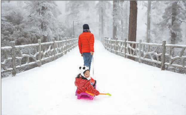
1月16日,四川洪雅县瓦屋山栈道上,一位父亲拉着孩子在雪地里滑行。当日,2020安逸四川·冬游天府旅游季——瓦屋山冰雪嘉年华启动仪式举行。

21世纪第三个十年的大门徐徐打开。在世界大变局与中国新时代相互激荡的大时代,中国特色大国外交必将乘风破浪,坚定前行,书写更加精彩壮丽的篇章。(参与记者:陈彩) (新华社北京1月18日电)