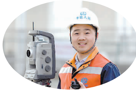
田间正在用测量仪工作。

过去10年间，小自己四岁的弟弟的学习与生活开销，全部压在田间一人身上，后来父亲病重、离世，他便成为了家里的顶梁柱。