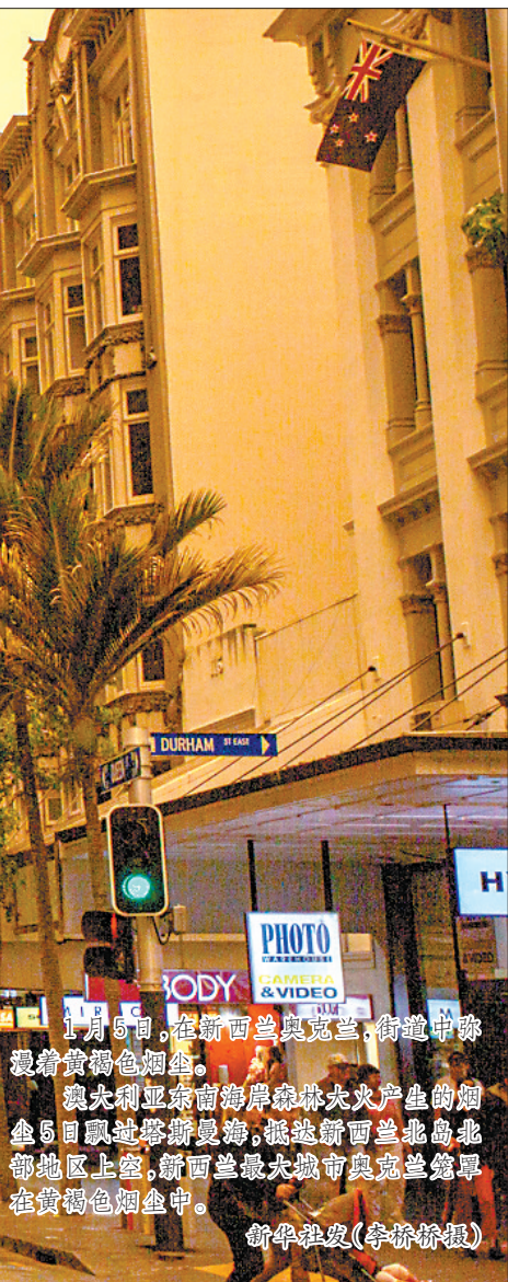
1月5日,在新西兰奥克兰,街道中弥漫着黄褐色烟霾。 澳大利亚东南海岸森林大火产生的烟霾5日飘越塔斯曼海,抵达新西兰北岛北部地区上空,新西兰最大城市奥克兰笼罩在黄褐色烟霾中。

赵晓晨 刚刚过去的这个周末,可能是澳大利亚数月来的森林大火危机中最危险的一天。 据当地媒体报道,3000名军队预备役人员被紧急征召协助灭火,澳政府还部署另一艘海军舰艇以协助灾民撤离。 而美国《时代》周刊的报道则称,目前火灾面积已达600万公顷,新南威尔士州30%的森林已被烧毁。截至1月5日,已有23人在大火中丧生。 浓烟甚至飘越数千公里来到新西兰,使这个邻国也笼罩在烟霾中,当地冰川甚至被烟灰熏成了褐色。 正常的城市生活不可避免地受到了影响。 长期以来,悉尼是澳大利亚乃至全世界空气最好的城市之一。但这次持续数月的大火产生的有毒烟雾,一度让悉尼成了世界上空气污染最严重的城市。 火灾还形成了罕见的气候现象。 澳大利亚当局说,由于林火产生的热气惊人,它已开始形成自己的气象系统,包括干燥雷雨和火龙卷。 这场大火甚至改变了总理莫里森的出行行程。 1月4日,澳大利亚政府表示,为应对日益严峻的森林火灾,总理莫里森原定本月对日本的访问将推迟。同时,莫里森也推迟了原定本月对印度的访问。 每年的9月到次年3月,都是澳大利亚的林火季节。2009年2月,一场被称为“黑色星期六丛林大火”的灾难,造成173人死亡,1万多人受伤,是有记录以来澳大利亚最严重的山林火灾。 有科学家指出,正是全球变暖让2019年的野火季提早开始,火灾比往年更密集、频繁,成为自1950年有记录以来最严重的一年。 但莫里森此前并不赞同这种说法,曾多次否认大火肆虐与气候变化有关。 不过,随着火势的蔓延,莫里森的态度开始有所变化,承认气候变化与森林火灾的联系;但他仍然坚持政府的气候政策不应该为大火“背锅”。 这就是澳大利亚这场持续数月大火背后更深层次的博弈:民众和反对党指责政府应对气候变化不力,总理莫里森则需要在国家