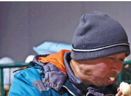
↑1月1日,中铁七局北京地铁12号线09标工人在安华桥下30米处进行隧道掘进施工。