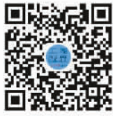
更多精彩扫码关注