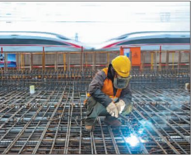
→1月1日,中铁四局引江济淮沪蓉改建02标项目经理部施工现场,工人正在进行焊接作业,身后复兴号高铁快速奔驰。