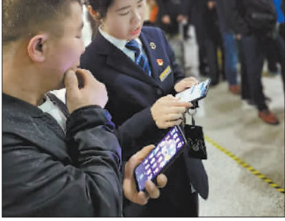
↑1月1日,无锡火车站工作人员正在为旅客推荐和操作完成候补购票新业务。