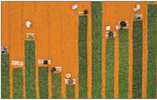
↓1月1日,在贵州省铜仁市玉屏侗族自治县朱家场镇詹家坳村,村民们正在茶叶苗圃基地打插茶苗。