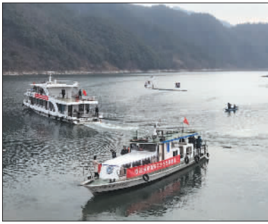
↓1月1日,皖浙跨省渔业联合执法行动在歙县深渡码头举行。当天,新安江歙县段开始全面禁捕。