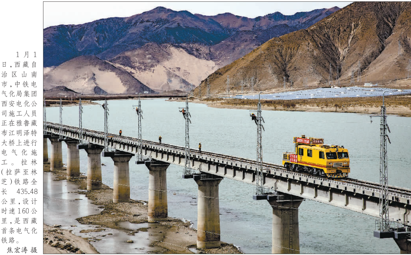
1月1日,西藏自治区山南市,中铁电气化局集团西安电化公司施工人员在雅鲁藏布江明泽特大桥上进行电气化施工。拉林(拉萨至林芝)铁路全长435.48公里,设计时速160公里,是西藏首条电气化铁路。