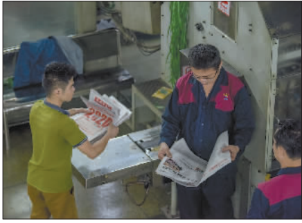
↑1月1日凌晨2时许,海南日报报业集团印刷厂,工作人员对刚刚印刷出来打包好的报纸进行抽样检查。