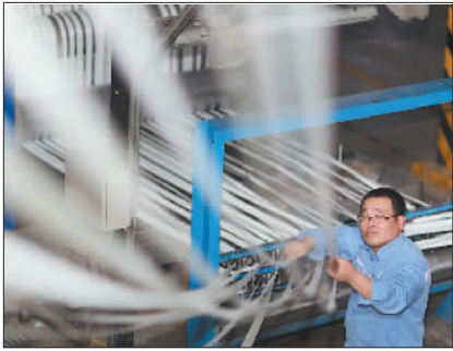
↓1月1日,天津石化化工部纺丝车间,当班职工正在对生产的短丝质量进行检查。