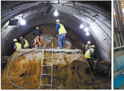
←1月1日,2022年北京冬奥会氢气“新能源”保供项目现场,燕山石化化学品厂区内施工工人正在紧张施工。