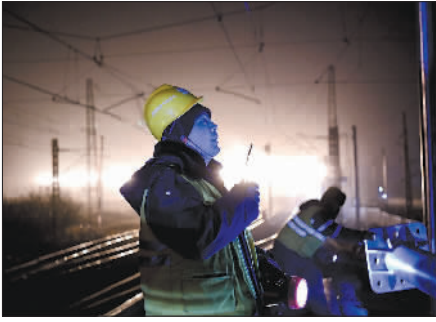
↑1月1日凌晨,在京哈铁路电气化大修工程滦县站,中铁电气化局的员工在严寒中进行安装作业。