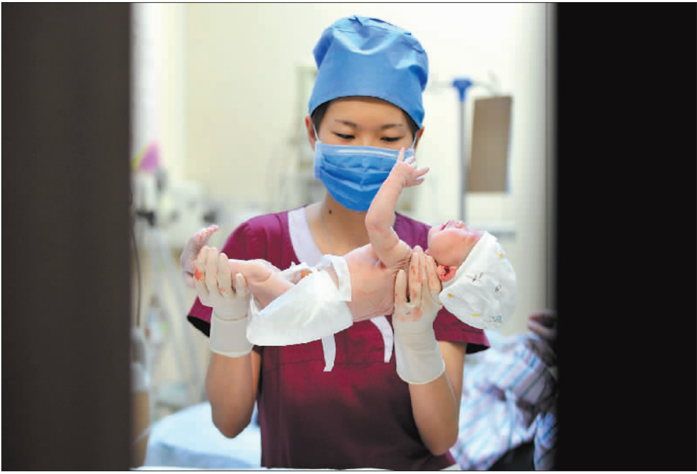
←2020年1月1日0时33分,北京大学第一医院妇产儿童医院的产房传来新年的第一声婴啼,第一批“20后”宝宝降生。