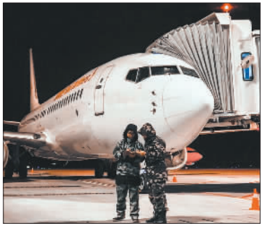
↓1月1日凌晨,南通兴东国际机场新年第一架飞机监护岗交接,操作员靠桥操作检查。