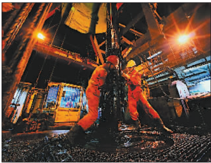
↑1月1日凌晨,涠洲作业公司涠洲12-2油田(中国海油有限湛江分公司)工人正在进行海上平台作业。