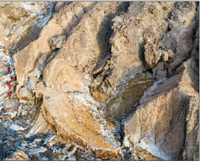
→1月1日,中国铁路西安局集团有限公司西安动车段检修库内,动车组机械师在对动车车下部件进行检查。