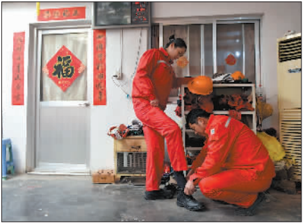
↑1月1日凌晨,新钢集团公司焦化厂炼焦工人默默坚守在一线岗位,在1000多摄氏度高温下“与火共舞”。