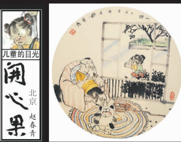
儿童的目光 开心果 北京 赵春青