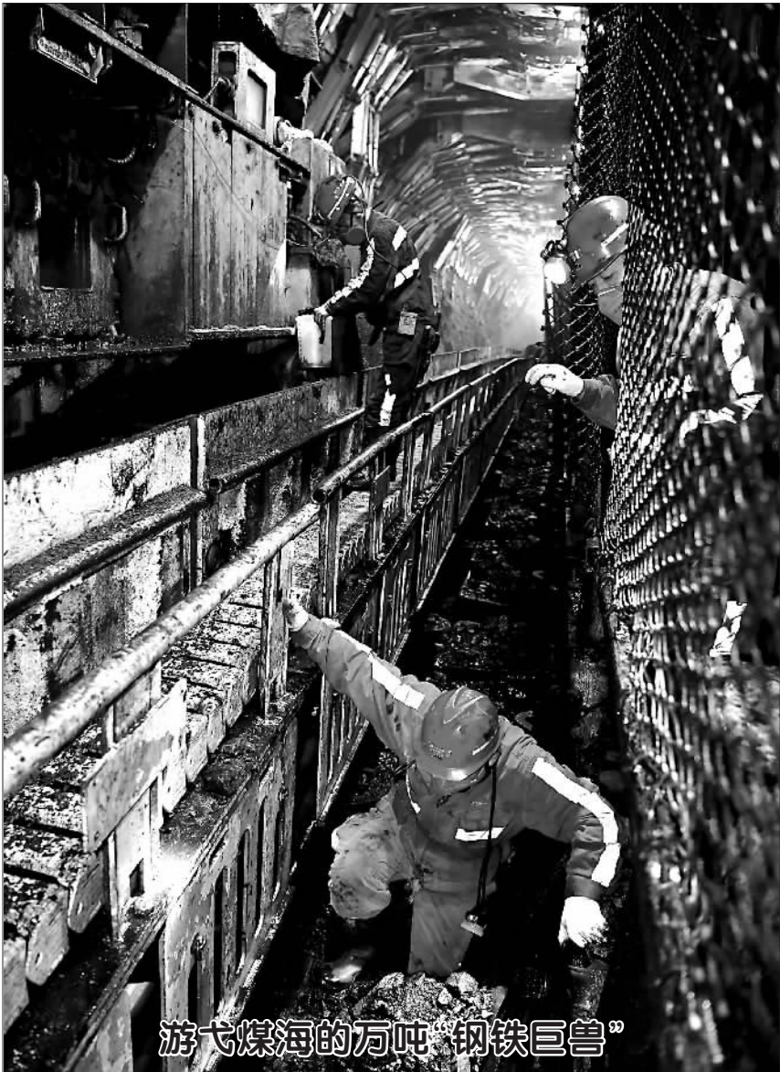
游弋煤海的万吨“钢铁巨兽”