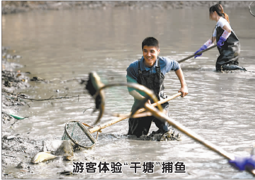
游客体验“干塘”捕鱼

青山就是金山银山”实践创新基地和第三批84个国家生态文明建设示范市县进行了授牌命名。本次年会同时举办生态示范创建与“两山”实践创新论坛以及14个专题平行分论坛,并向社会发布《生态文明·十堰宣言》、中国西部生态文明发展报告、2019年度生态文明建设优秀论文和优秀调研报告等成果。