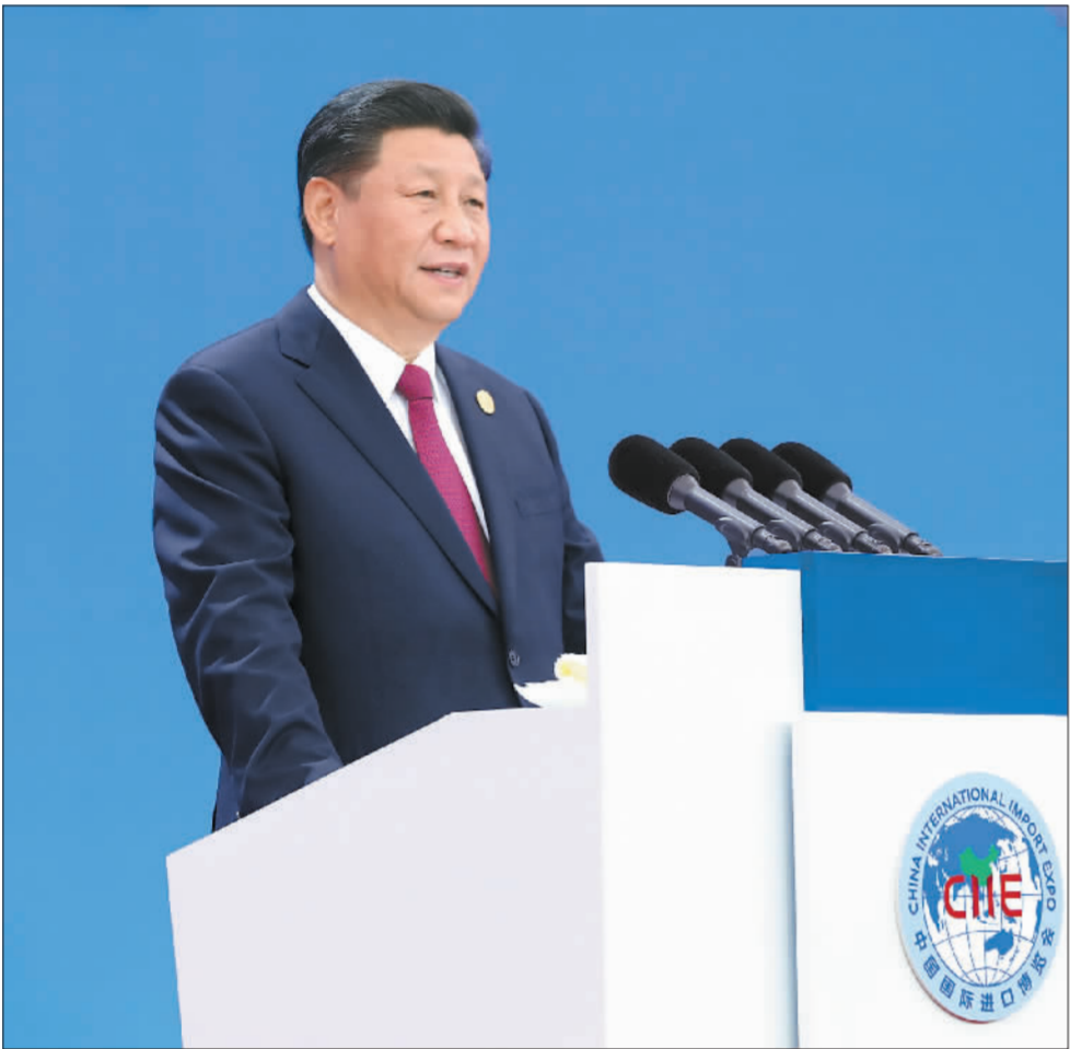
11月5日，第二届中国国际进口博览会在上海国家会展中心开幕。国家主席习近平出席开幕式并发表题为《开放合作 命运与共》的主旨演讲。