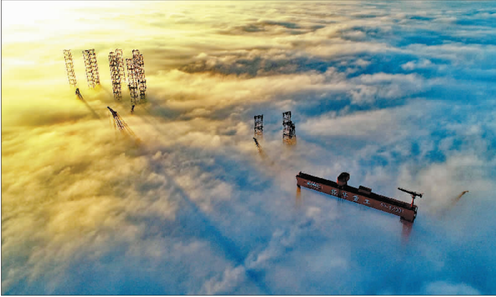
金奖 《云端之上》 (组照之一)