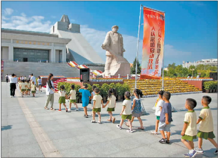
《学习铁人从小做起》