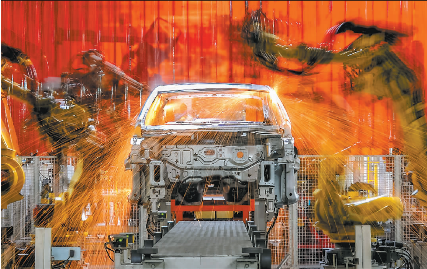
金奖 《焊接机器人舞》

9月23日,第六届全国职工摄影展在全国总工会大楼举行开幕式后,开启了全国巡展,长沙是巡展的第一站。按照组委会安排,所有入选的优秀作品将在全国部分城市巡回展览和网上展出。