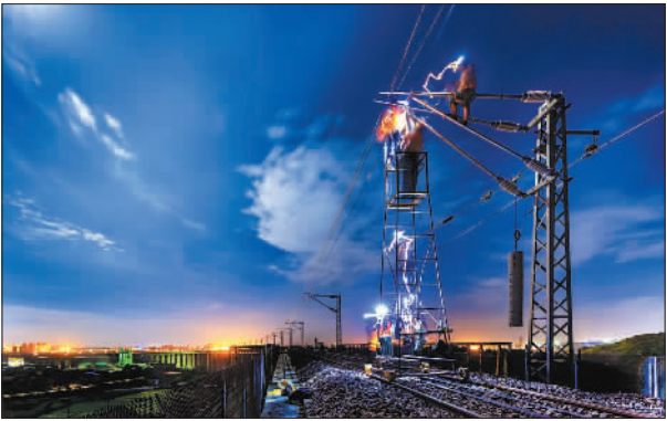
金奖 《披星戴月保畅通》