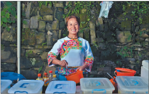
金奖 《十八洞的笑脸》(组照之一)