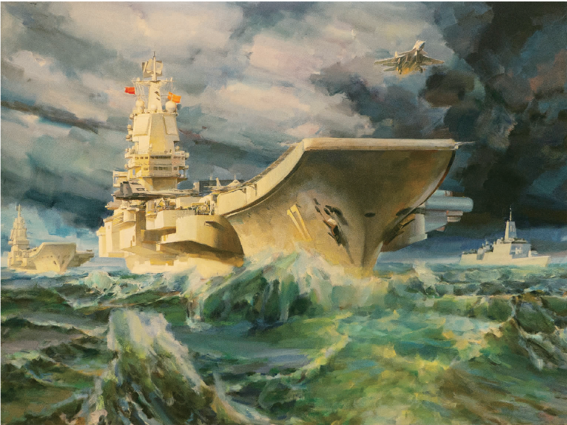
大国重器——中国航母(油画)