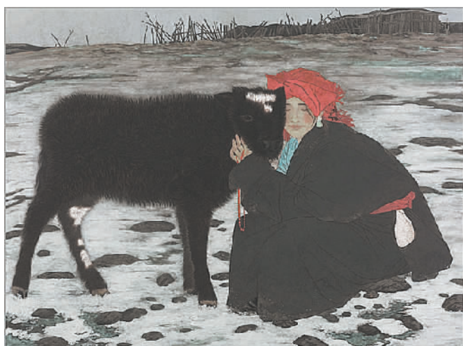
伙伴——家园(纸本设色) 【中国】孙震生