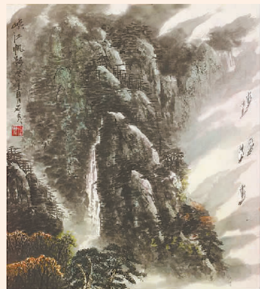
峡江帆影 (国画) 傅石义

作为一个画家,从传统来看,他还正值旺年。他自己也清醒意识到此阶段的重要,不光要纵览百家,还要探索前景。这应该是有意识既学习大家又有意识求变的一个重要的原因。学画者,既要师古又不提倡泥古,既要师承一派又要发扬一派,这样才能不断提高个人修为同时发扬艺术传统。(建国)