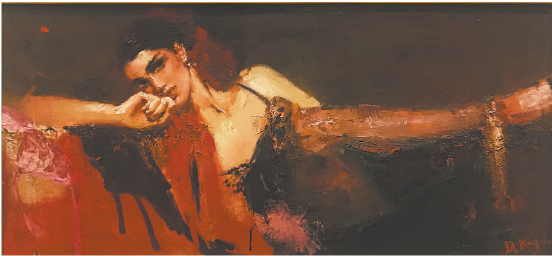
小憩(油画) 【俄罗斯】卡捷柯娃·达丽娅