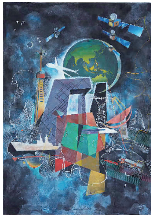
星耀寰宇——中国北斗卫星导航 (油画) 袁 泉