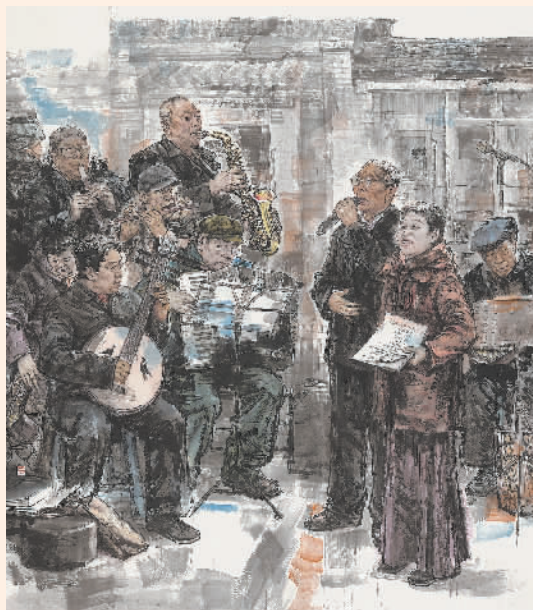
岁月如歌 (国画) 李铁林