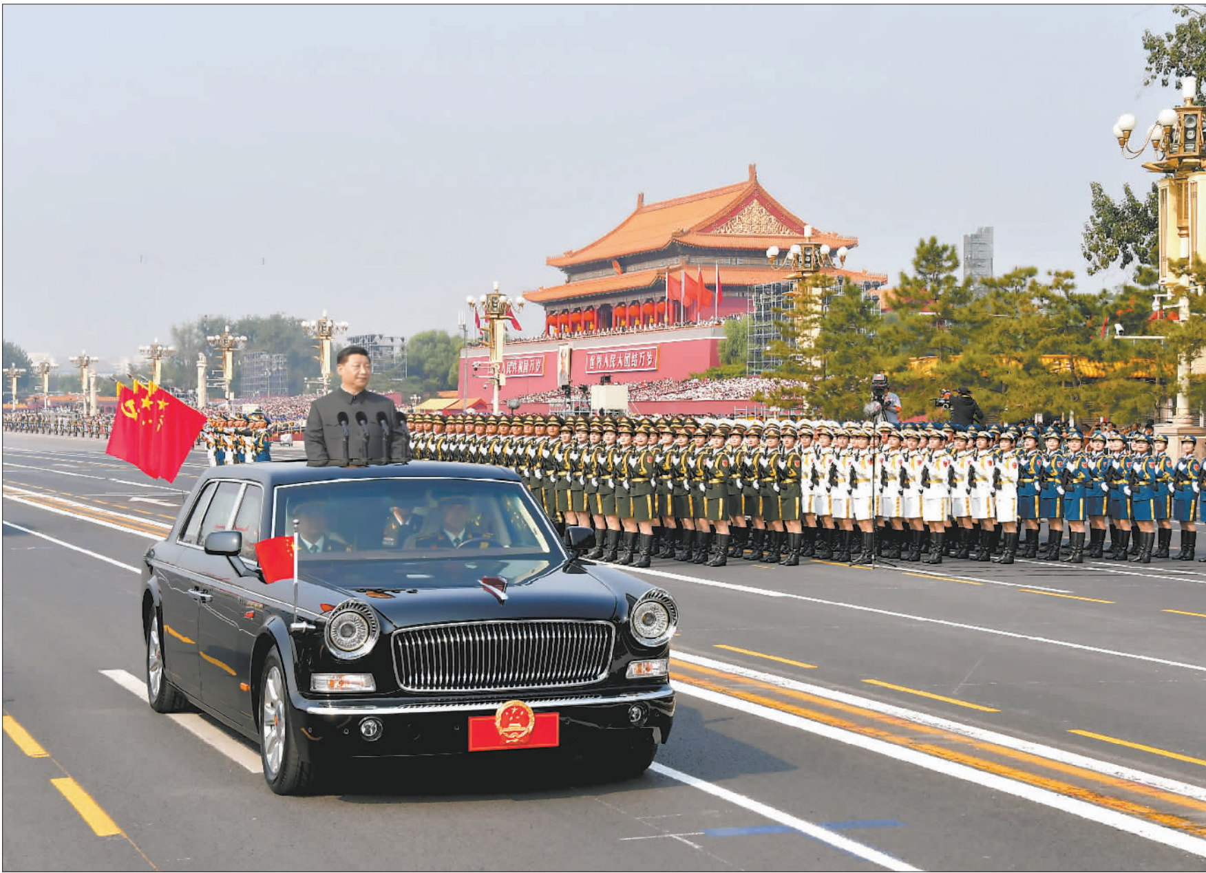
10月1日,庆祝中华人民共和国成立70周年大会在北京天安门广场隆重举行。这是中共中央总书记、国家主席、中央军委主席习近平检阅受阅部队。

新华社北京10月1日电 壮阔七十载,奋进新时代。10月1日上午,庆祝中华人民共和国成立70周年大会在北京天安门广场隆重举行,20余万军民以盛大的阅兵仪式和群众游行欢庆共和国70华诞。中共中央总书记、国家主席、中央军委主席习近平发表重要讲话并检阅受阅部队。 中共中央政治局常委、国务院总理李克强主持庆祝大会。中共中央政治局常委、全国人大常委会委员长栗战书,中共中央政治局常委、全国政协主席汪洋,中共中央政治局常委、中央书记处书记王沪宁,中共中央政治局常委、中央纪律检查委员会书记赵乐际,中共中央政治局常委、国务院副总理韩正,国家副主席王岐山出席。 国庆佳节之际,神州大地山河壮丽,万众欢腾,首都北京花团锦簇,旌旗飘扬。 蓝天丽日下,天安门城楼庄严雄伟。城楼红墙正中悬挂着毛泽东同志的巨幅彩色画像。城楼檐下8盏大红灯笼引人注目,东西平台上8面红旗迎风招展,烘托出喜庆的节日气氛。 天安门广场上,大型“红飘带”主题景观庄重、灵动,寓意红色基因连接历史、现实、未来。人民英雄纪念碑前,竖立着伟大的革命先行者孙中山先生的画像,巨大的“国庆”“1949”“2019”立体字样分外醒目。 上午9时57分,在欢快的乐曲声中,习近平等党和国家领导人来到天安门城楼主席台,向广场观礼台上的各界代表挥手致意。全场爆发出雷鸣般的掌声。 天安门广场上的大型电子屏幕中出现了钟摆的画面。1949、1959、1969……2019,随着钟摆,年份数字依次显现。报时钟声响起,10时整,庆祝大会开始。 全体起立,70响礼炮响彻云霄,国旗护卫队官兵护卫着五星红旗,迈着铿锵有力的步伐,从人民英雄纪念碑行进至广场北侧的升旗区。中国人民解放军联合军乐团奏响雄壮的《义勇军进行曲》,全场齐声高唱中华人民共和国国歌,鲜艳夺目的五星红旗冉冉升起,在天安门广场上空迎风飘扬。 随后,习近平发表重要讲话。他首先代表党中央、全国人大、国务院、全国政协和中央军委,向一切为民族独立和人民解放、国家富强和人民幸福建立了不朽功勋的革命先辈和烈士们,表示深切的怀念,向全国各族人民和海内外爱国同胞,致以热烈的祝贺,向关心和支持中国发展的各国朋友,表示衷心的感谢。 习近平在讲话中指出,70年前的今天,毛泽东同志在这里向世界庄严宣告了中华人民共和国的成立,中国人民从此站起来了。这一伟大事件,彻底改变了近代以后100多年中国积贫积弱、受人欺凌的悲惨命运,中华民族走上了实现伟大复兴的壮阔道路。70年来,全国各族人民同心同德、艰苦奋斗,取得了令世界刮目相看的伟大成就。今天,社会主义中国巍然屹立在世界东方,没有任何力量能够撼动我们伟大祖国的地位,没有任何力量能够阻挡中国人民和中华民族的前进步伐。 (下转第4版)