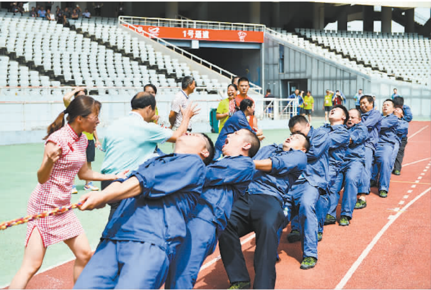
江西省第四届职工运动会拔河比赛。

运气很好。”江西省第四届职工运动会象棋比赛近日落下帷幕,来自九江瑞昌市肇陈镇的48岁业余象棋选手柯善林一鸣惊人,夺得男子设区市组的冠军。