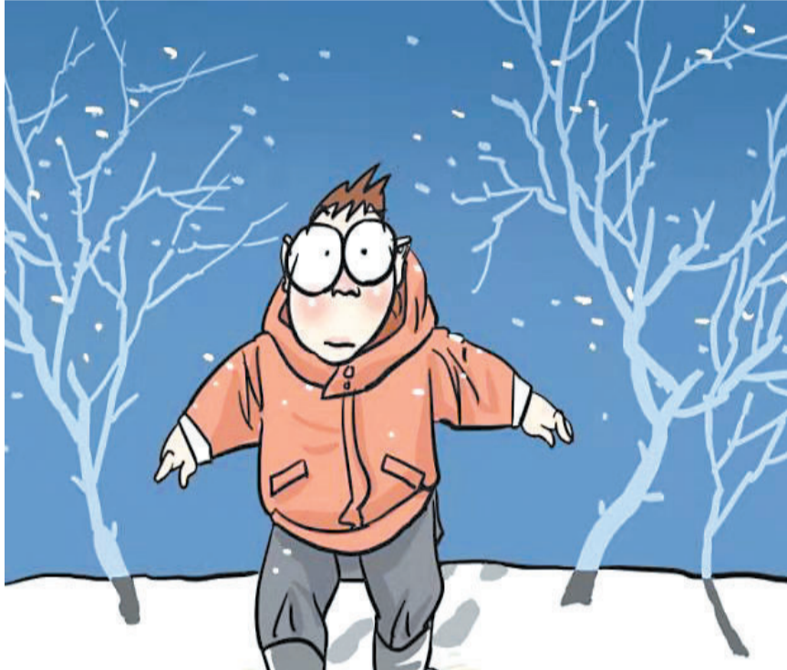
欲望和下雪一样,积的越多路就越少。

直到多年以后,我到一所林业院校读书,在《植物学》课本上,看到了这样一行字:芦苇,多年水生或湿生的高大禾草,又名蒹葭……这才恍然大悟,原来,我背了多年的蒹葭,就是小时候天天能看到的芦苇啊!故乡有很多芦苇荡,我们常常用芦苇的管儿做成苇笛,吹奏出一曲曲好听的乐曲。每当秋天到来的时候,芦花就变成了白色,成片成片地随风起舞,成为起伏起伏的波浪。掐一枝芦花拿在手中,放在嘴边轻轻一吹,花絮便飘散开来,像烟花一样形成了瞬间的灿烂。如今,我远在地他乡定居,这里也有成片的芦苇荡,每当秋风起、芦花白的时候,我便会想起故乡的芦苇荡。 生命中曾有过许多流浪的岁月。还记得最初的那次流浪,是在暮春时节离开家乡的,那一天,杨柳依依、春风轻柔,我提着简单的行李,站在村口的小桥旁,回望那个生活了十多年的小山村,心中蓦然涌起一缕伤感和惆怅。以后的岁月中,便是在不断的漂泊中度过的,大漠孤烟的雄浑,长河落日的悲壮;江南不断的春雨,塞外烈烈的长风……流浪的日子是累人的,但我的生命却是充实的,因为在流浪的过程中,我学到了许许多多。年关岁尾的时候,我非常想家,便买了一张回程车票,匆匆踏上了回家的旅程。到家的时候,正是一个大雪纷飞的日子,我是在黄昏时分走到村口的,望了一眼雪花中的小山村,回想起春天离开时的情形,以及这一年来经历的风雨艰难。想起了《诗经》中的那句诗:“昔我往矣,杨柳依依。今我来思,雨雪霏霏!”两颗泪,默默地流了出来,滴在了故乡的雪地上! 直到年龄很大时,我才收获了自己的爱情和婚姻。我对爱情的理解是唯美的,认为