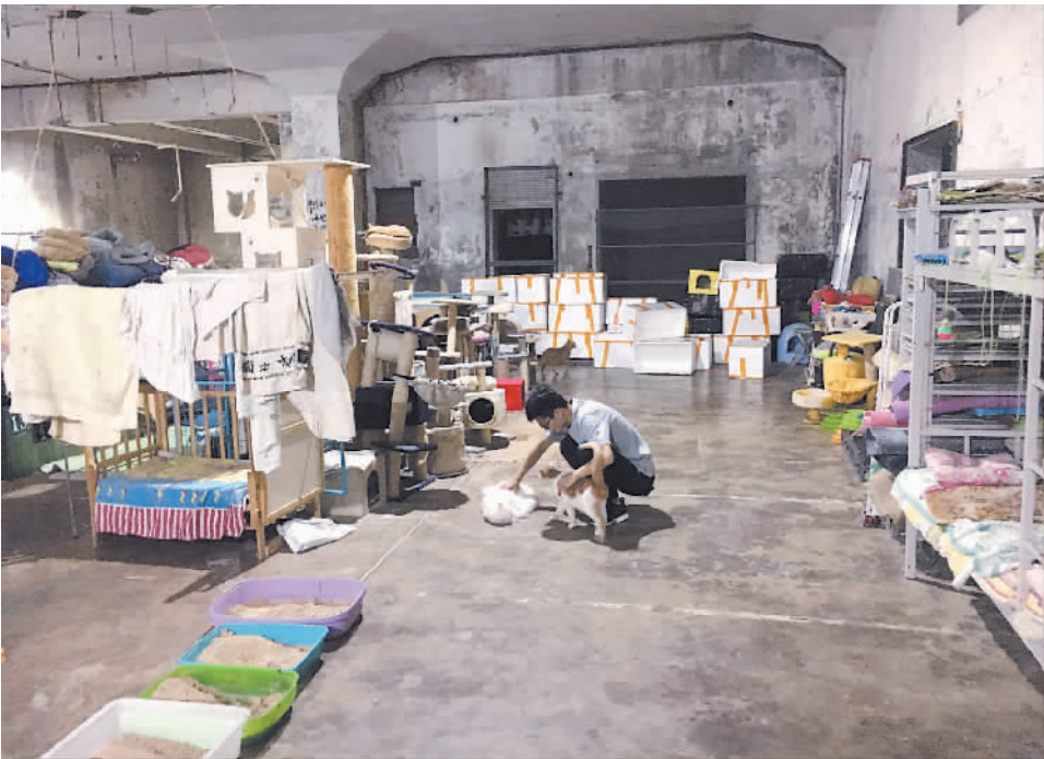
猫咪在地下猫城不缺吃喝,却缺一个真正的“家”。