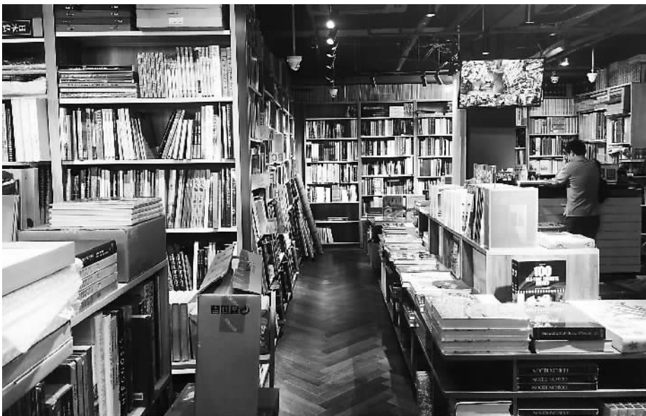
这是一间与北京中央美术学院相隔一条街的小型书店,主要针对美术学院的师生,除专业书籍外,还有多种原装进口图书。开业差不多5年了。运营方面“还可以,但压力也很大。”店员坦承。

据了解,为了振兴实体书店,建设书香中国,2016年,教育部等11部委联合印发《关于支持实体书店发展的指导意见》,提出高校应至少有一所达