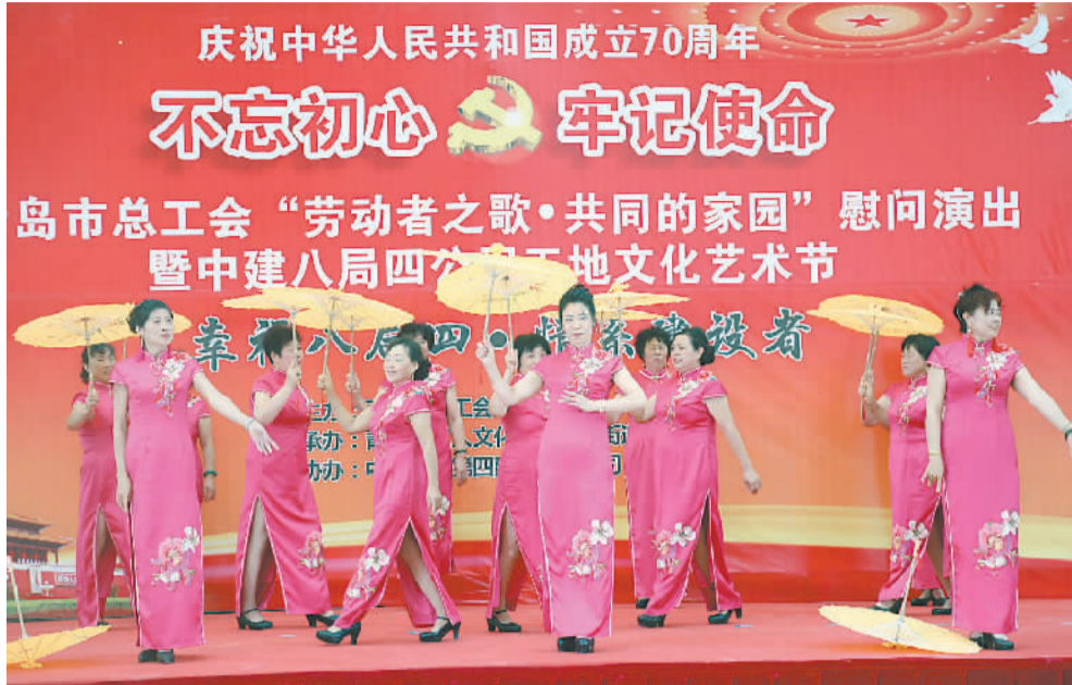
“劳动者之歌·共同的家園”慰问演出现场

2005年国庆节,青岛市工人文化宫会议室上演了一场精彩的演出,200余名农民工代表欢聚一堂。这,便是“共同的家園”的雏形。 这一年,为丰富和活跃农民工精神文化生活,青岛市总工会以“共同的家園”为主题,开展了系列活动,慰问演出便是其中之一。 “农民工兄弟是我们的新市民,是城市发展的动力,是青岛大家庭的一分子,所以才有了‘共同的家園’这个名字。”董灏大概也没想到,当初这台联欢晚会的主题,如今成为市总工会一项重要的文化服务品牌。 联欢会出乎意料的成功。新市民们像过年一样的高兴,不由自主地和着节拍手舞足蹈,脸上洋溢的笑容感染了在场每一个人。 此后,“共同的家園”便成了青岛市总工会的常态化工作,由最开始的一年一场,到后来的一年十场、一百场,演出范围也逐渐扩大至企业、社区。 文化宫不仅创作了主题曲《共同的家園》,邀请著名词曲作家姜世奎谱写了《工人兄弟,我亲爱的伙伴》,还根据基层职工的特点和喜好专门创作排练了内容形式多样的节目,如歌曲、相声、舞蹈、魔术、杂技、小品等。400多名演员,把演出送到了青岛各区县,为基层职工送去了无微不至的关怀和青岛大家庭的温暖。