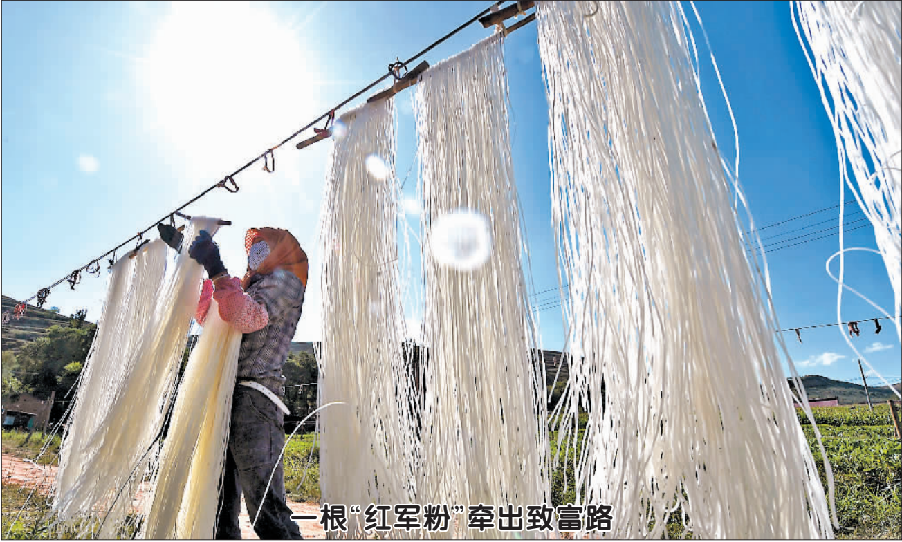
一根“红军粉”牵出致富路

本报北京8月12日电 (记者王瑜)记者今天从国家海洋环境预报中心获悉,今年第9号台风“利奇马”(热带风暴级)16时仍位于山东省潍坊市北部近海,中央气象台预计“利奇马”将回旋少动,强度维持或略有减弱。国家海洋预报台今天下午将海浪和风暴潮警报级别均降为蓝色。 海浪实况显示,今天13时,受“利奇马”的影响,渤海出现3到4米的大浪到巨浪区,黄海北部和中部出现2.5到3.5米的大浪区;河北、辽宁、山东北部近岸海域出现2到3米的中浪到大浪。未来随着台风的逐渐减弱,浪高也将逐渐减小。 预计8月12日夜间到8月13日白天,渤海、黄海北部将出现2.5到3.5米的大浪区,河北、辽宁、山东近岸海域将出现1.5到2.5米的中浪到大浪,海浪预警级别为蓝色。国家海洋环境预报中心提醒在上述海域作业的船只注意安全,沿海各有关单位提前采取防浪避浪措施。 风暴潮方面,预计今天下午到8月13日下午,辽宁沿海将出现40到70厘米的风暴增水,渤海湾和莱州湾沿海将出现60到150厘米的风暴增水,山东半岛北部沿海将出现50到100厘米的风暴增水。上述岸段内的山东潍坊、蓬莱潮位站将于今天晚上出现达到当地蓝色警戒潮位的高潮位。山东省潍坊市和烟台市的风暴潮预警级别为蓝色。