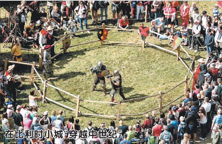
在比利时小城“穿越中世纪”

构建契合新时代要求的中日关系,要互补优势,互通有无,推动各领域双边合作提质升级。中日都已步入发展新阶段,各自面临新的挑战 and 机遇。应该看到,因发展阶段不