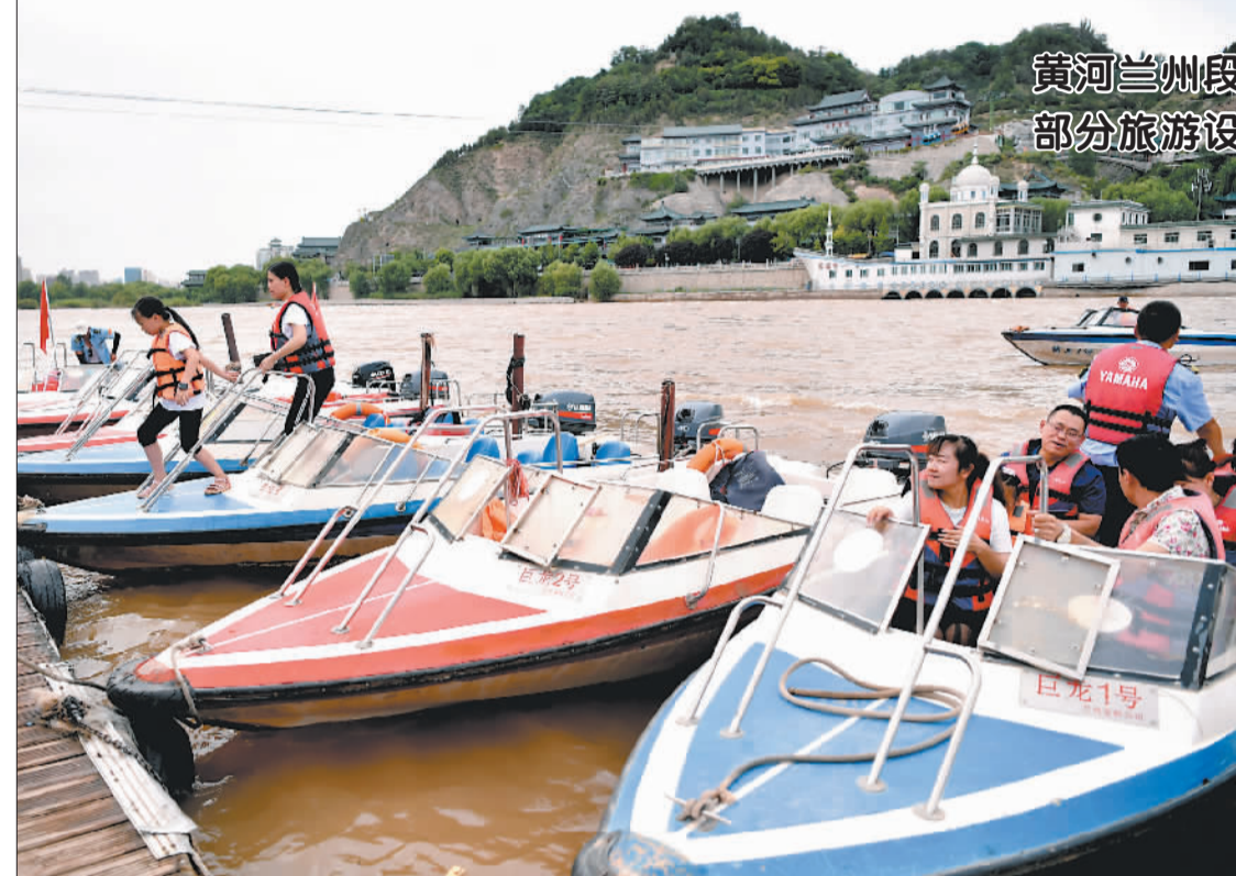
黄河兰州段水位回落 部分旅游设施重开放

8月7日,游客在黄河兰州段索道码头乘坐快艇观光。 受刘家峡水库出库流量调减影响,当前黄河兰州段水位逐渐回落,此前因水位过高暂时关闭的部分沿河公园、索道码头等设施已完成清淤工作并重新开放。