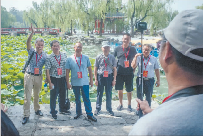
7月30日,劳模们参观颐和园,在荷花池前合影留念。