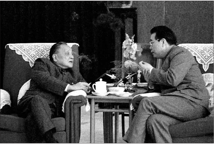
▲1988年，邓小平同志与李鹏同志在北京人民大会堂福建厅交谈。