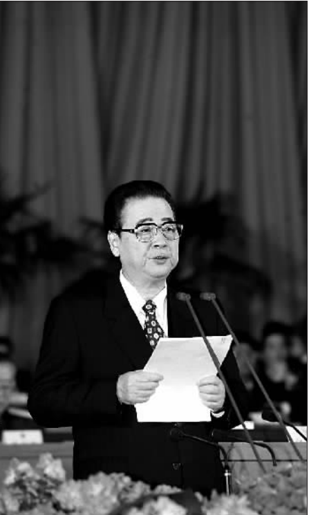
▲1998年3月19日，九届全国人大一次会议在北京人民大会堂胜利闭幕。李鹏同志在闭幕式上讲话。