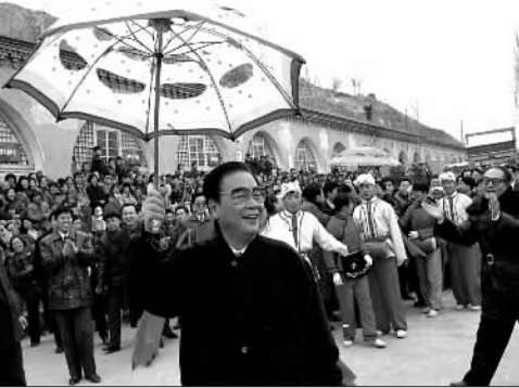
▲1992年6月12日，李鹏同志在联合国环境与发展大会首脑会议上发言。