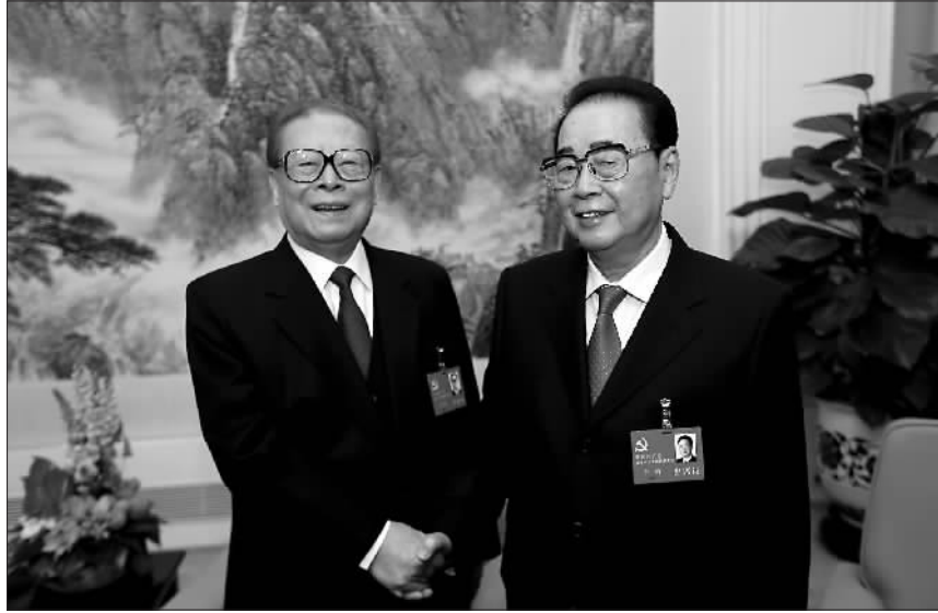
◀2012年11月14日，在党的十八大闭幕前，习近平同志同李鹏同志在一起。 新华社记者 兰红光 摄 ▲2012年11月8日，在党的十八大开幕前，江泽民同志同李鹏同志在一起。 新华社记者 兰红光 摄