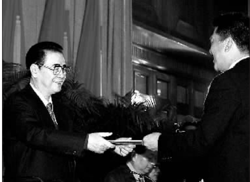
▲1997年7月1日凌晨，中华人民共和国香港特别行政区成立暨特区政府宣誓就职仪式在香港会议展览中心新翼七楼隆重举行。香港特区首任行政长官董建华宣誓就职，李鹏同志监誓。