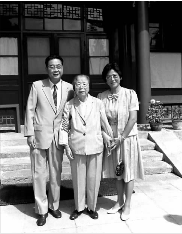
▲1986年，邓颖超同志和李鹏同志及夫人朱琳在北京中南海西花厅合影。