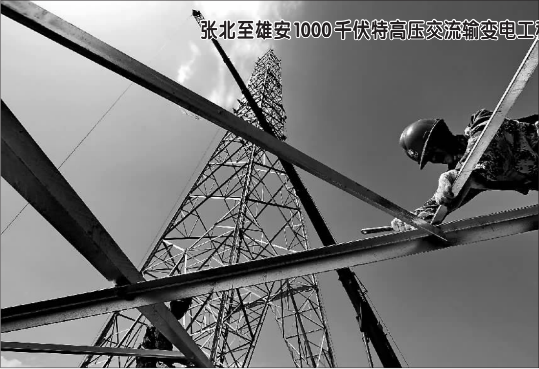
张北至雄安1000千伏特高压交流输变电工程加紧施工

7月25日,在河北省怀安县第六屯境内,工人在张北至雄安1000千伏特高压交流输变电工程施工现场组立输电线路铁塔。