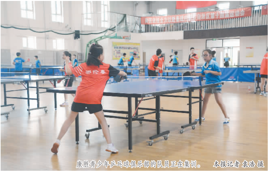
康胜青少年乒乓球俱乐部的队员正在集训。

浩特市长期训练的青少年队员有1400余人，一些优秀的学员还代表内蒙古自治区参赛。”内蒙古自治区体育局青少年处副处长王浩琴告诉记者。