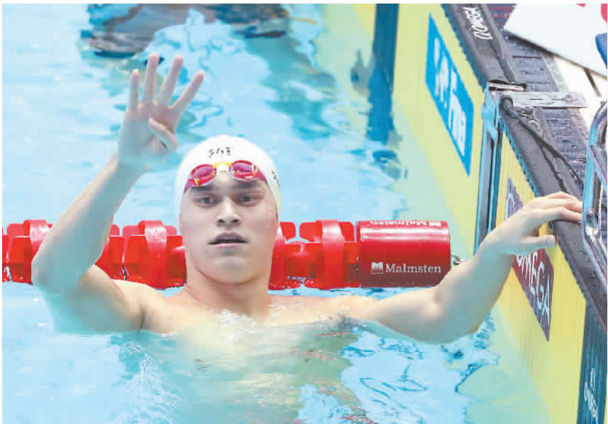
7月21日，中国选手孙杨在赛后比出四连冠的手势。

新华社韩国光州7月21日电(记者耿学鹏 周欣 卢羽晨)21日晚，韩国光州南部大学