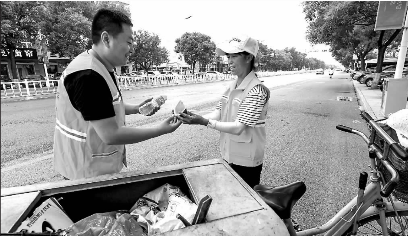
7月16日,志愿者(左)为在街上工作的环卫工人送去西瓜和矿泉水。近日,高温闷热天气持续,河北省香河县环卫工人将西瓜、矿泉水、解暑药品等送到环卫工人手中,送去夏日清凉。

郭学斌表示，市级工人文化宫建成后，将面向全市职工举办一系列培训教育、技能竞赛、文体比赛等活动，让工人文化宫成为职工接受培训教育的“大学校”，提升技能素养的“新舞台”、丰富精神文化生活的“好乐园”。