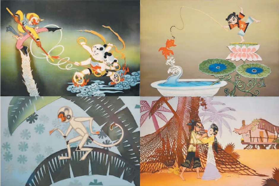
漫画作品《大闹天宫》(左上)、《渔童》(右上)、《等明天》(左下)、《金色的海螺》(右下)

时光走到今天,日本已是世界上最大的动画制作和输出国,而中国动漫虽然进入发展的快车道,但尚未形成强大的产业带动力。当孙悟空再遇阿童木,需