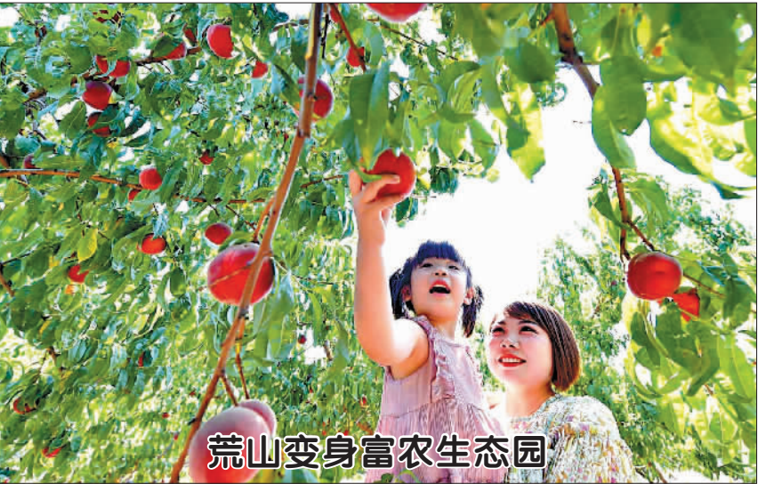
荒山变身富农生态园

计实现营业收入1985.9亿元,比2017年增长9.4%;其中,年营收过亿元的99家,比2017年增加14家。有241家实现营收增长,占比达七成。 相关负责人表示,当前山东老字号企业总体发展良好,但企业间发展不均衡。青岛啤酒、烟台张裕、东阿阿胶、德州扒鸡等老字号已成为知名国际品牌。346家老字号企业中,已有半数的企业开展了电子商务。但还有一部分企业仍停留在传统家庭作坊式生产阶段,没有建立现代企业制度,企业规模不大,品牌知名度不高,有的甚至处于亏损经营状态,保护和传承面临严峻挑战。