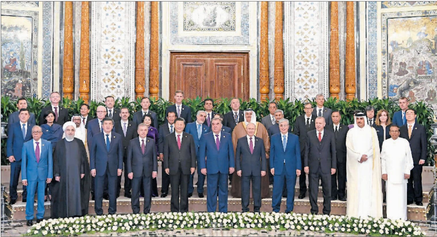
6月15日,亚洲相互协作与信任措施会议第五次峰会在塔吉克斯坦首都杜尚别举行。国家主席习近平出席峰会并发表重要讲话。这是出席会议的亚信成员国领导人或代表,观察员国代表以及有关国际和地区组织代表集体合影。