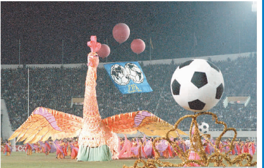
图为1991年11月16日,首届世界女子足球锦标赛在中国广东省广州市天河体育中心体育场开幕,这是开幕式上的文体表演《金凤展翅》。

发诟病密不可分。上届女足世界杯开始前,以美国女足明星瓦姆巴赫为首的一批顶尖球员向国际足联发起法律诉讼,认为国际足联对待男女不平等:男足的比赛都是天然草,而不少女足比赛都是在更容易让球员受伤的人工草皮上进行。