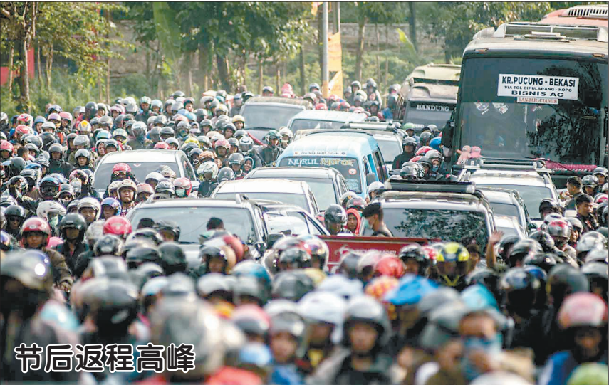
节后返程高峰 6月8日，印度尼西亚西爪哇省万隆，传统节日开斋节过后，民众集中返程，形成出行高峰。