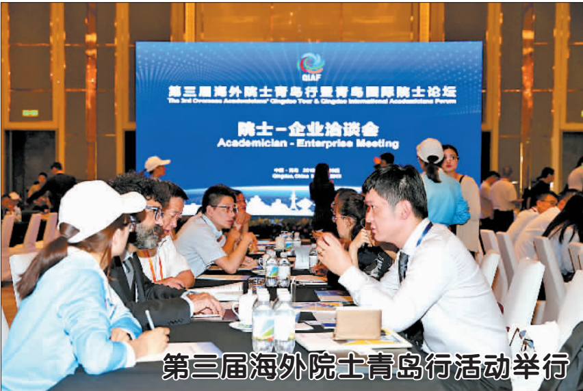
第三届海外院士青岛行活动举行

5月28日至30日,第三届海外院士青岛行活动在青岛举行,来自20多个国家和地区的近百名海内外院士参加。