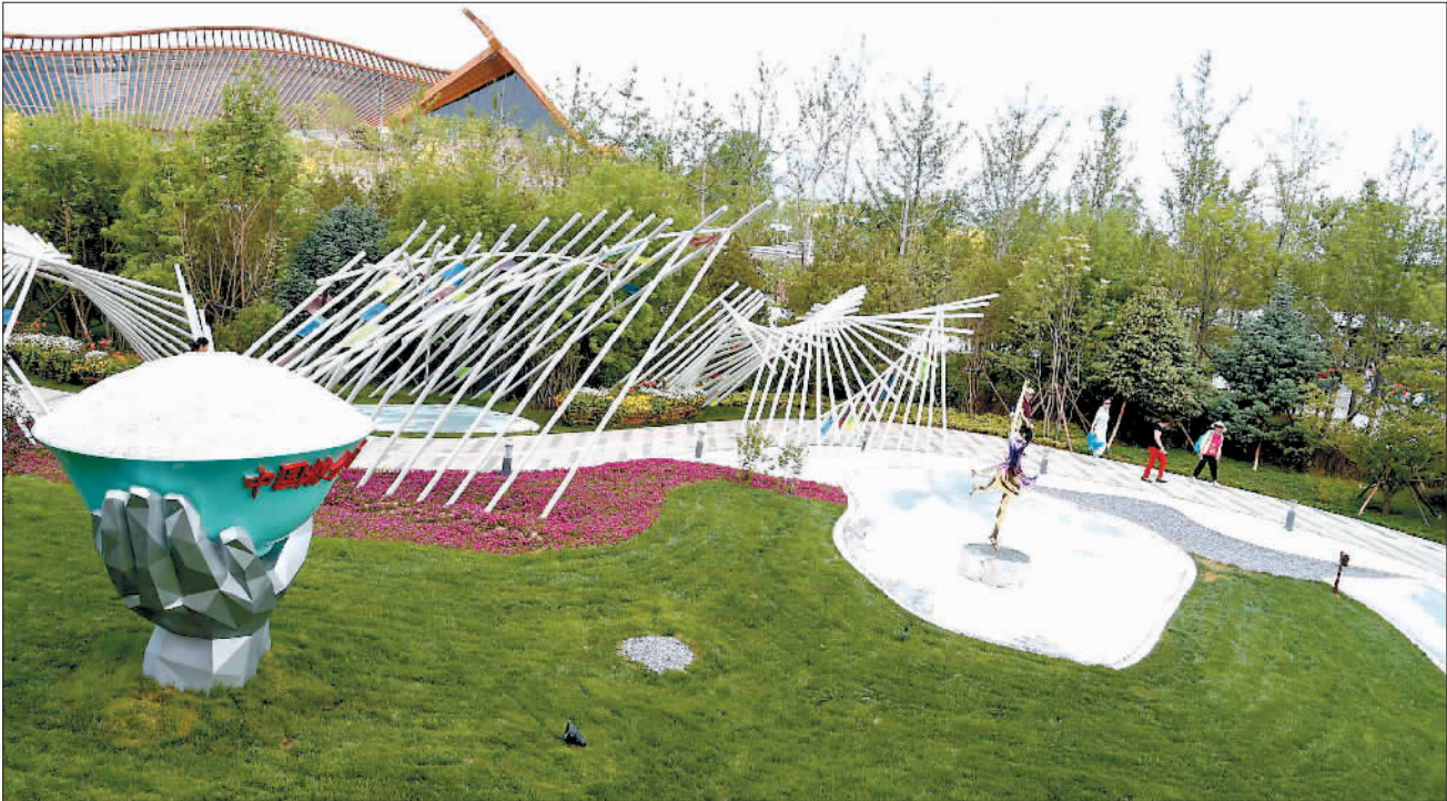
北京世园会举办“黑龙江日”活动

5月30日,游客在黑龙江园参观。当日,2019年中国北京世界园艺博览会“黑龙江日”活动在北京世园会园区举行。