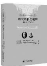
[美]彼得·伯格 [德]托马斯·卢克曼 著 吴肃然 译 北京大学出版社

社会知识库包含着与我的处境有关的知识,也透露出我可能遭遇的限制。比如我知道自己很穷,因此不希望住在高档的郊区。对于这种知识,穷人和富人当然都懂。 《现实的社会建构》是知识社会学的经典之作,也是社会建构论的扛鼎之作,更是社会学领域影响较大的著作之一。该书不仅将知识社会学的考察范围,从少数人关心的科学和理论知识,拓展到一般人在日常生活中用以指导行动的知识,而且以生动的笔法,揭示了作为“客观现实”和“主观现实”的社会,到底是如何构成的,又具有怎样的特性。 本书融汇了现象学的洞察与人文主义的关怀。对于矫治社会学理论的退隐,该书至今仍有警示和启迪作用。 (晓阳)