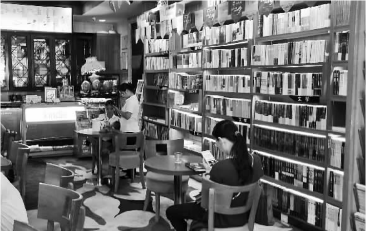
海南第一家24小时书店

在海口市的近郊,有一家骑行俱乐部,经营者声称,绿色的运动,甚至环保的出行习惯培养,是健康的生活态度和方式。并且,读书同样是健康的时间消磨方式(生活方式)。 在这一理念下,新华书店系统和四肢运动机构