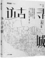
唐克扬 著 中信出版社

古城是人类历史文明的绝佳见证者,记录了人类文明在不同历史阶段的兴衰演进的线索。同时,古城也是旅游爱好者探访名单上的必去之所,它们像一颗颗熠熠生辉的宝石,吸引着无数人前往朝圣。 在《访古寻城》一书中,哈佛大学设计学博士唐克扬先生绘制了12座知名古城的探访指南,配以丰富的历史资料图片与生动的文字解读,带领读者穿行于古城遗迹的街巷之中,循着时间的足印,摩挲当下与过往间的裂痕。 什么才是我们所能认知的历史城市?在所见的部分之外,古城还存有哪些我们不知道的故事?如果被看见才能证明存在过,那么那些不可见的部分的意义何在?又是否确凿无疑地存在过?被密封存储的记忆,将流传还是终丧失?《访古寻城》可以满足那些意欲踏足古城的人的眼睛与心灵的双重需求。