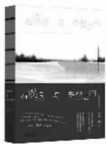
达达·尚 著 百花文艺出版社

达达·尚原本是一个大学老师,过着稳定而富足的生活。几年前,为了追求心中热爱的艺术,她辞去工作,凭借双手和才华,开始行走在路上。 她走过兰州、北京、上海、南宁、广州、丽江、西安、三亚等城市,走过日本、美国等国家,遇到民谣、画画、文学、爱情、友谊、纯真、正义、勇气,还遇到最爱的木心。在一个人遇到一个丰富的世界后,她渐渐遇见理想中的自己。 流浪不是简单的行走,而是一场自我的找寻和朝圣,是不囿于世俗和现实,按照自己喜欢的方式去生活,换取灵魂和心灵的法喜。因此作者说,若要现实的午餐,就周全不了所有的理想。我们能做的是,长途跋涉地返璞归真,光明磊落、堂堂正正。 本书是她在路上的所见、所闻,是她体悟人生的写照。