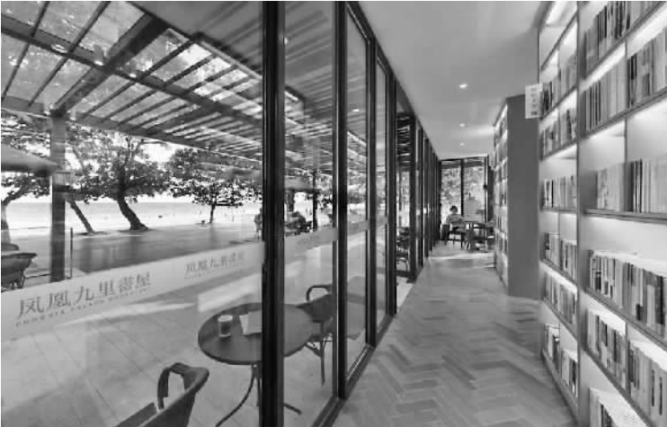
凤凰九里书屋外景

在海南万宁的石梅湾旅游度假胜地,坐落着荣膺“海南最美书店”称号的海边书店——凤凰九里书屋。这间600多平方米的书屋的确名不虚传。书屋独立安坐在风光旖旎的海湾边上,紧邻