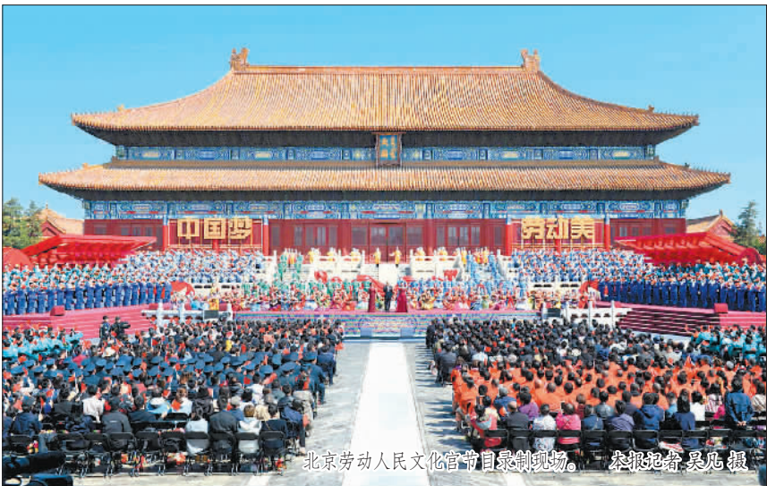
北京劳动人民文化宫节目录制现场。

本报北京4月26日电 (记者张锐 郑莉)“五星红旗迎风飘扬,胜利歌声多么响亮;歌唱我们亲爱的祖国,从今走向繁荣富强……”今天上午,在北京劳动人民文化宫内的太庙广场,随着著名艺术家和职工合唱团携手唱响《歌唱祖国》,由中华全国总工会、中央广播电视总台联合录制的“中国梦·劳动美”——2019年庆祝“五一”国际劳动节“心连心”特别节目隆重上演,为亿万劳动群众送上节日的问候和由衷的礼赞。全国和北京市劳模代表、一线职工等2000余人在现场观看演出。 喜迎新中国70周年华诞,为今年的“五一”国际劳动节增添了一份特殊的意义。“五一”特别节目以“中国梦·劳动美”为主题,紧紧围绕庆祝新中国成立70周年这条主线,分别在北京劳动人民文化宫和广东珠海航空工业通珠海研制制造基地设立会场,并在天安门广场、人民大会堂、港澳大桥、冬奥场馆建设工地、中国