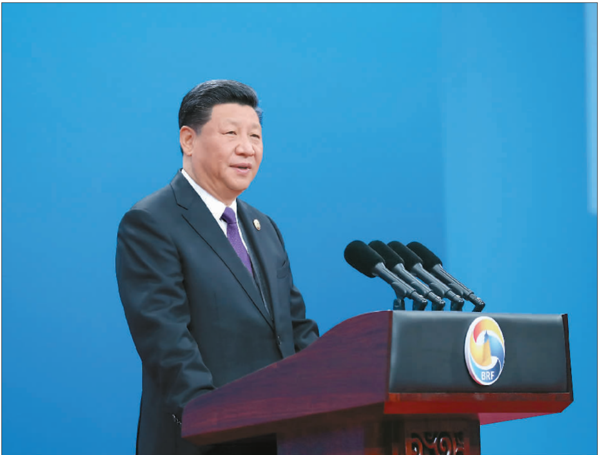
4月26日,国家主席习近平在北京出席第二届“一带一路”国际合作高峰论坛开幕式,并发表题为《齐心开创共建“一带一路”美好未来》的主旨演讲。