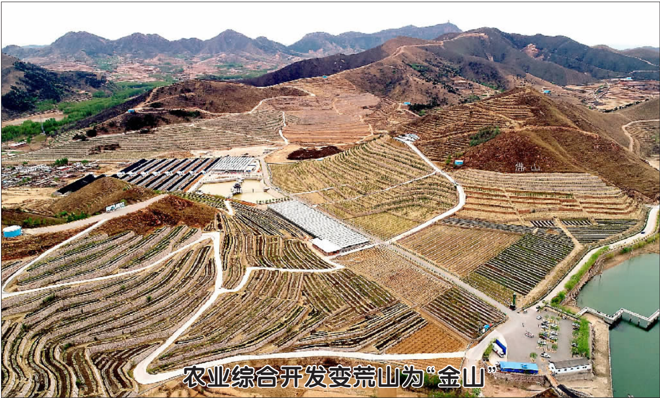
这是4月22日拍摄的河北省滦州市鸡冠山生态农业产业园(无人机拍摄)。 位于河北省滦州市九百户镇的鸡冠山原是一片荒山,2015年以来,当地政府依托农

本报讯(记者钱培坚)近日,江苏东台在上海举办“一路走来 还是东台”旅游推介会,现场成功签约旅游投资、旅游市场开发和旅游宣传等合作项目14个。 近年来,东台大力践行“两海两绿”路径,紧扣“融入长三角、建设新东台”主题,明确提出重点打造上海先进制造业协作基地、上海菜篮子基地、上海生态大公园的“两基地一公园”,铺陈出一幅品质高端、业态多元的新旅游秀美画卷。 “自然森呼吸,沪北金东台。”作为盐城黄海湿地申报世界级自然遗产的核心区,东台生态多样性保护良好。森林覆盖率达27.8%,空气良好率保持在78.6%以上,天然氧吧—黄海森林公园作为创始单位加入长三角生态旅游联盟。