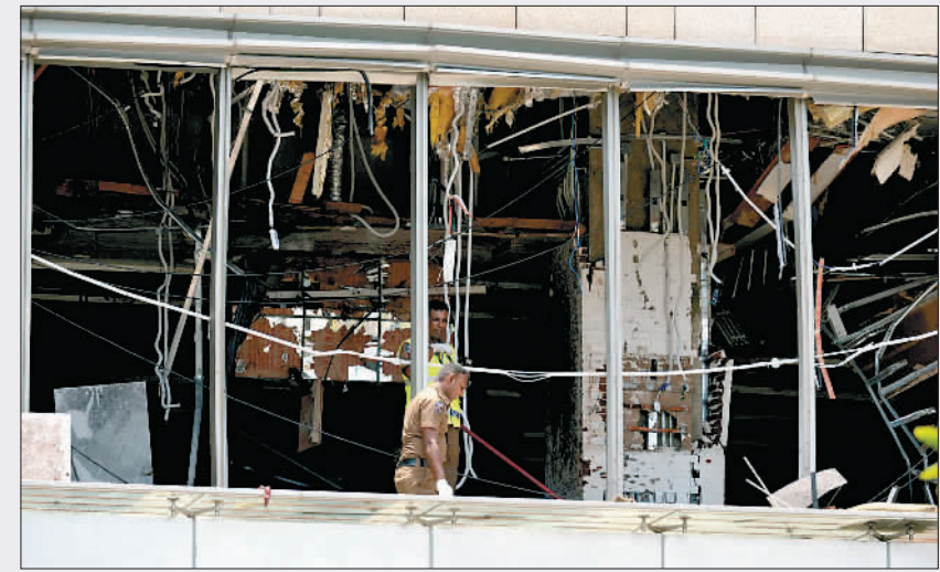
新华社记者 朱瑞卿 唐璐

巴基斯坦并发动袭击的,这些武装分子在伊朗有训练和后勤保障营地。 当天,库雷希与伊朗外长扎里夫举行了电话会谈。库雷希说,巴方希望伊朗方面采取措施打击武装分子,伊方已同意在调查后对这些武装分子采取行动。 18日凌晨,一伙伪装成巴安全部队人员的武装分子在巴西南部俾路支省拦截多辆大巴并枪杀了14人。经巴官方确认,死者全部来自巴安全部队。 随后,一个俾路支分离组织宣称制造了此次袭击。