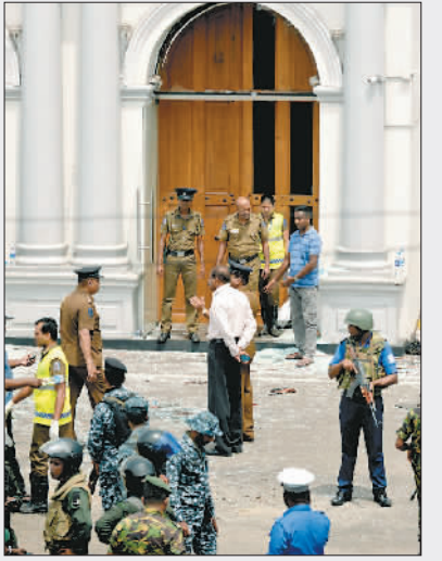
4月21日,在斯里兰卡科伦坡,安全人员聚集在发生爆炸的圣安东尼教堂外。 新华社发(哈普拉彻奇摄)

据当地媒体援引医院的消息,斯里兰卡首都科伦坡包括教堂、酒店等多个地点当天发生的爆炸造成的死亡人数已升至138人,另有500多人受伤。 新华社发(哈普拉彻奇摄)