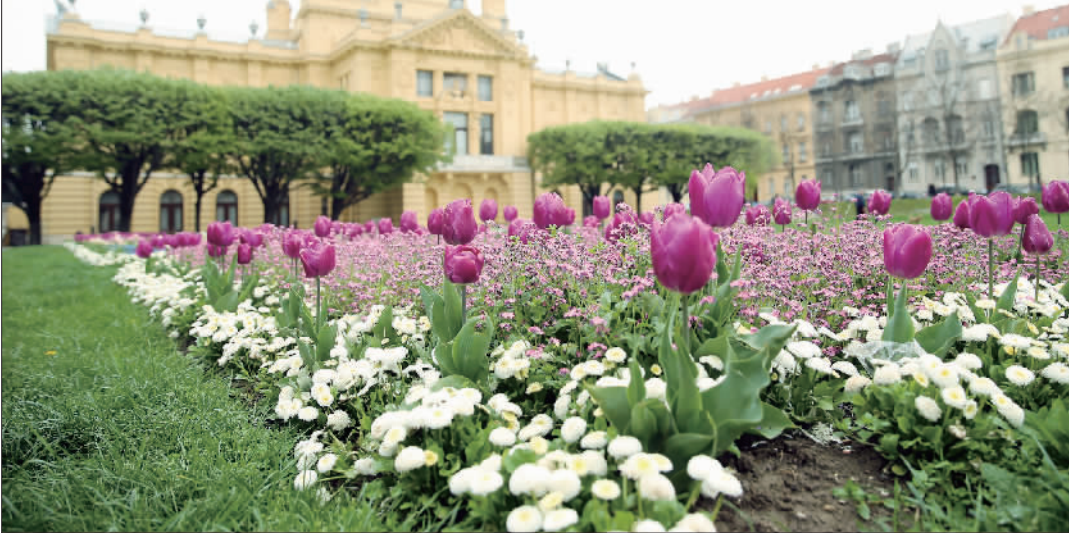
4月10日，在克罗地亚首都萨格勒布，一处广场鲜花盛开。