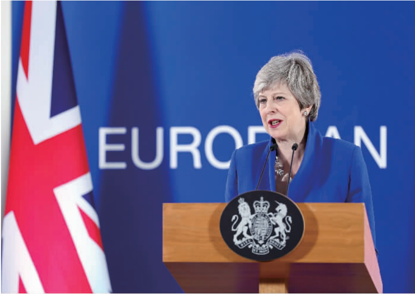
4月11日，在比利时布鲁塞尔，英国首相特雷莎·梅在新闻发布会上讲话。 据外电报道，欧盟和英国11日同意将英国“脱欧”日期推迟至10月31日。

文章强调，“脱欧”后英国与欧盟间人员、货品不再能自由流通，恐会恶化目前的医疗人员危机。尤其是在“硬脱欧”情况下，因为缺乏进出口的法律框架，恐对药品、疫苗、医