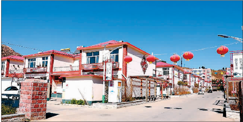
经过几年美丽乡村建设,西柏坡镇梁家沟村样貌大变,街道干净整洁、楼房整齐林立。图为西柏坡镇梁家沟村。